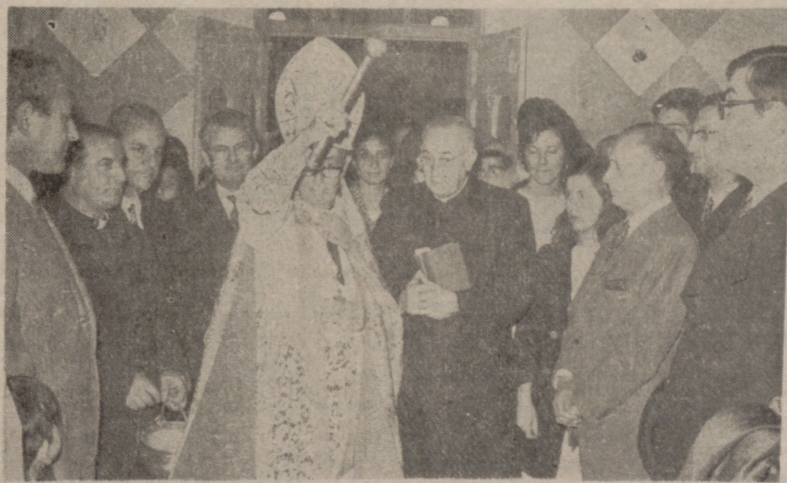
BENDICION DEL NUEVO DOMICILIO