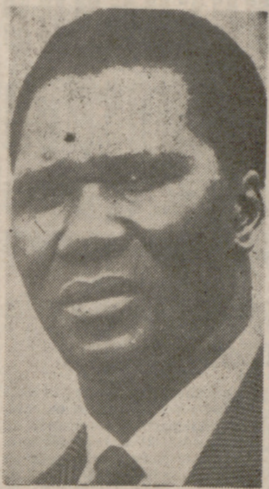
El Presidente guineano, Sekou Toure.

La Guinea portuguesa dicen que constantemente recibe ataques de guerrilleros venidos de las dos naciones con las que tiene fronteras, es decir la República de Guinea y el Senegal, y jamás podría lanzarse a una absurda tentativa de invasión como ésta de la que ahora acusa Sekou Toure.