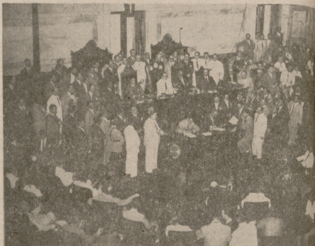
El general Perón presidiendo, en 1949, la Asamblea Constituyente que reformó la Constitución argentina.

Los fenómenos políticos, violentos o no, a los que asistimos estos días en Chile, Perú, Bolivia y en todo el espacio abarcado por la agitación de las guerrillas campesinas o los comandos urbanos castristas, guevaristas o extremistas de Guatemala a Argentina y Uruguay, tienen sus antecedentes y precursores. Desde el poder o contra el poder. Todos llevan en su programa de Gobierno o en su bandera de rebelión las mismas consignas que sus antecesores de los años 40, de los años 30 e incluso de 1910, fecha de la Revolución Mexicana. Nacionalismo frente a un "imperialismo", político o económico, extranjero, de la otra orilla de Río Grande o europeo; participación de las masas populares, incluidas las mesizas e indias, en la riqueza del país; industrialización de unas economías esencialmente productoras y exportadoras de materias primas, para obtener la independencia económica, o trato de tú a tú sin los que no cabe la independencia política.