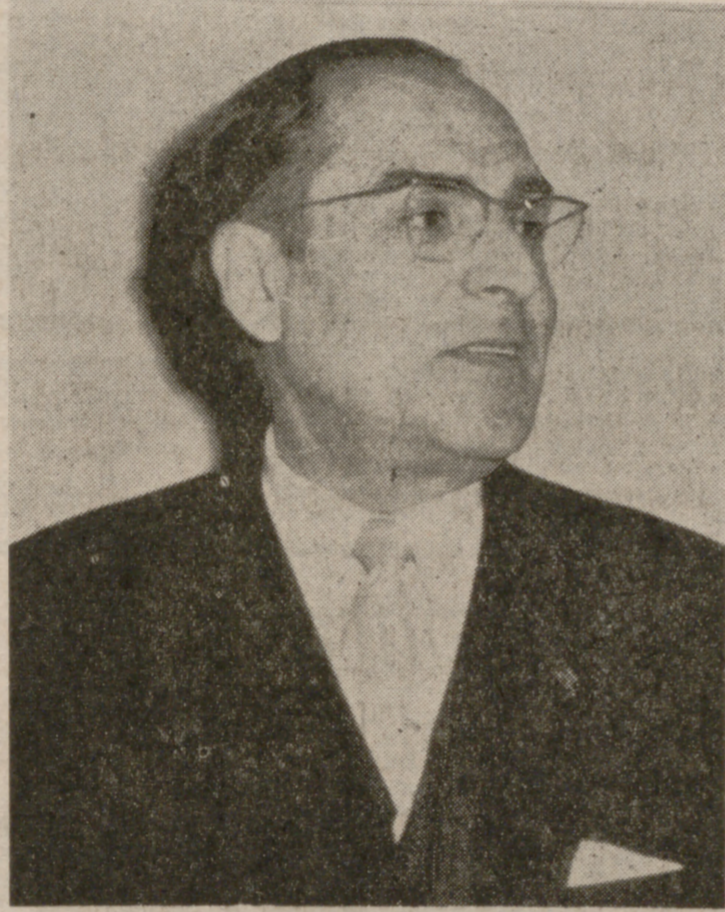
EL DIRECTOR DE LA CORAL VALLISOLETANA

música me hace sentir y soñar. —¿Cuál fue la primera vez que dirigió usted la Coral?