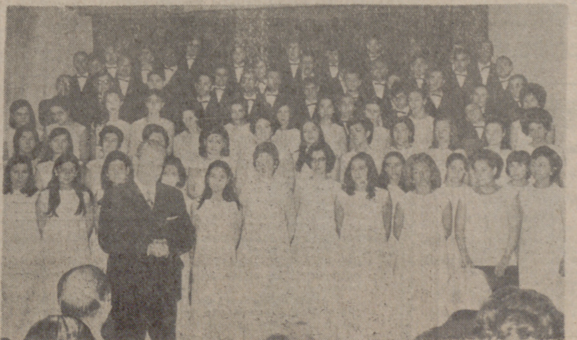
LA CORAL, CON EL ALCALDE