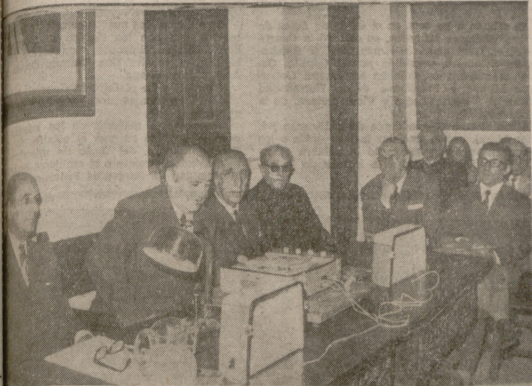
PRESIDENCIA DEL ACTO