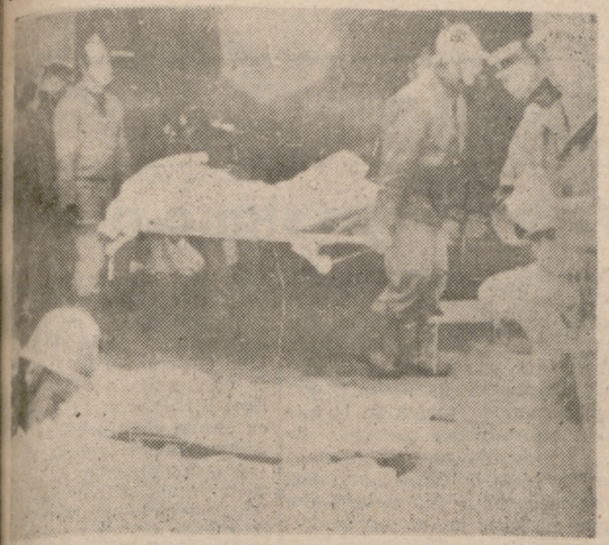
SANT LAURENT DU PONT (Isere, Francia).—La sala de fiestas "Cinq Sept" que ha quedado destruida por un violento incendio que siguió a una explosión de gas. En el siniestro han muerto 144 jóvenes. En la foto, un aspecto de los trabajos de rescate de víctimas.