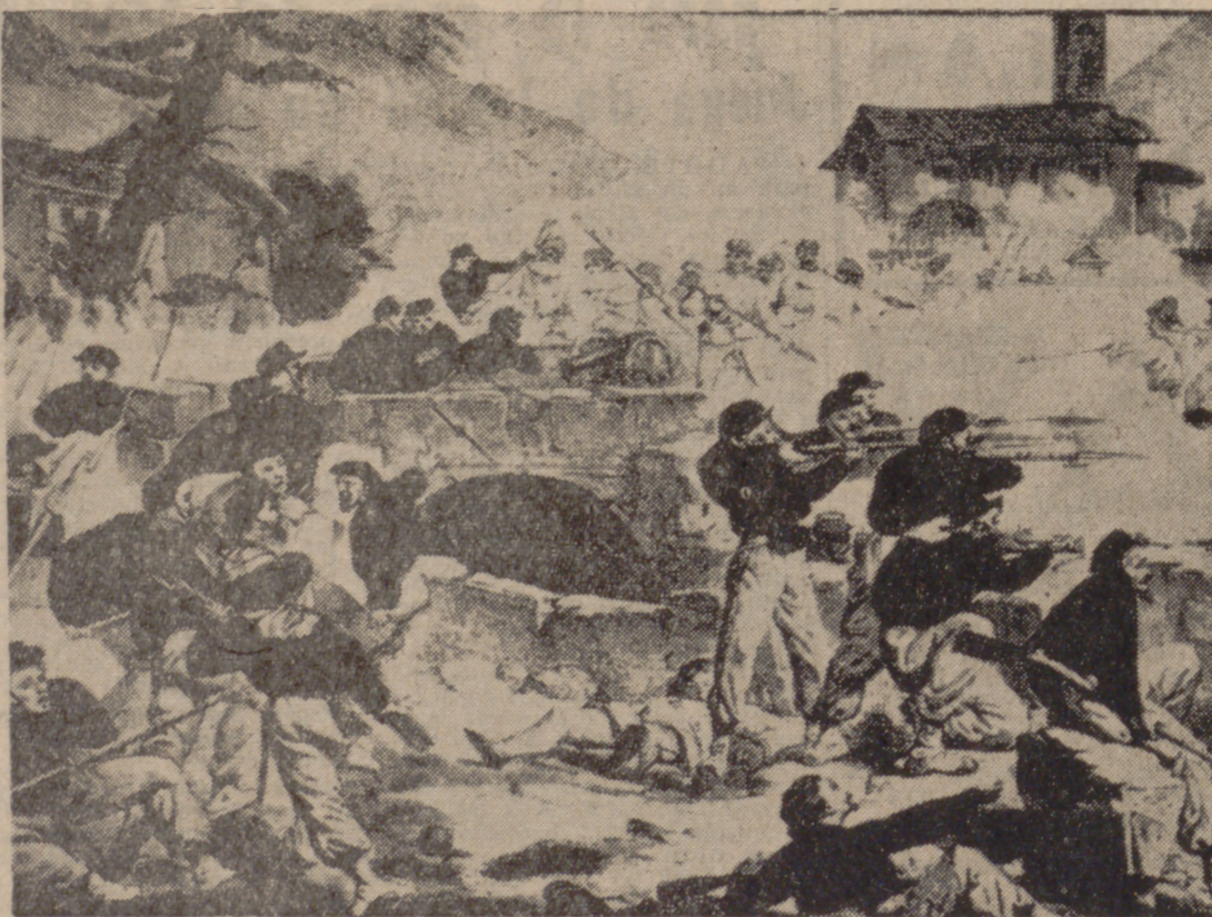
Los Camisas Rojas garibaldinos combatían con heroísmo.