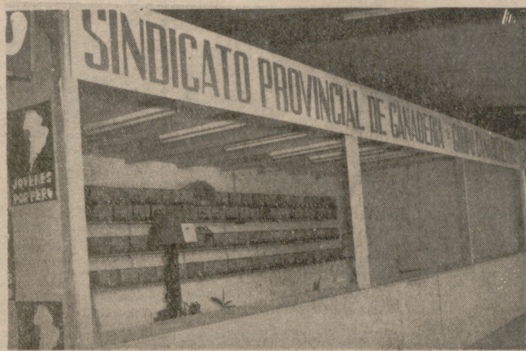
PABELLON DE CANALICULTURA

asistencia muy numerosa en el Teatro Valladolid.