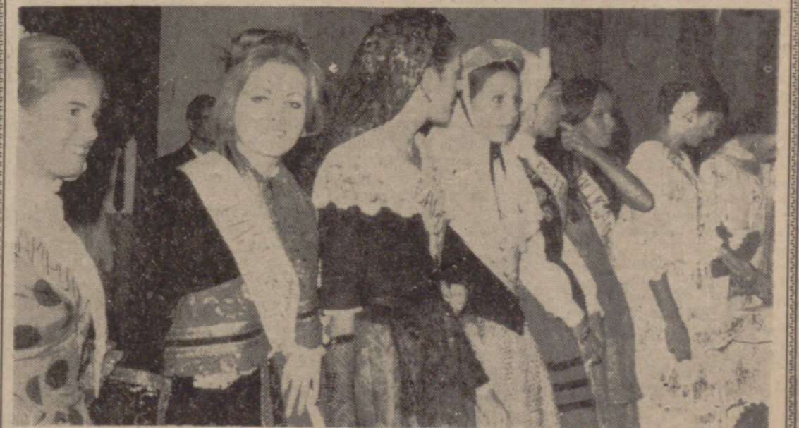
CADIZ.—Desde el domingo se encuentran en esta capital las representantes de las distintas provincias que participarán en el concurso para la elección de "Miss España". En la foto, un grupo de dichas representantes durante la recepción que les fue ofrecida en el Ayuntamiento gaditano.