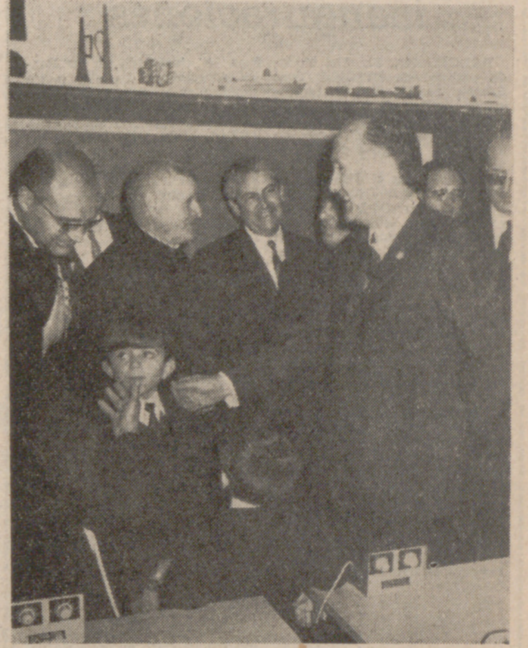
El ministro durante su visita a las instalaciones de la Obra Social del Santuario.

Cerró el acto don Licio de la Fuente, quien en sus primeras palabras transmitió un sentido personal del Jefe del Estado y del Vicepresidente del Gobierno, unidos en todo momento a las intenciones de la Obra Social del Santuario, al tiempo que expresó su satisfacción por haber sido designado para este