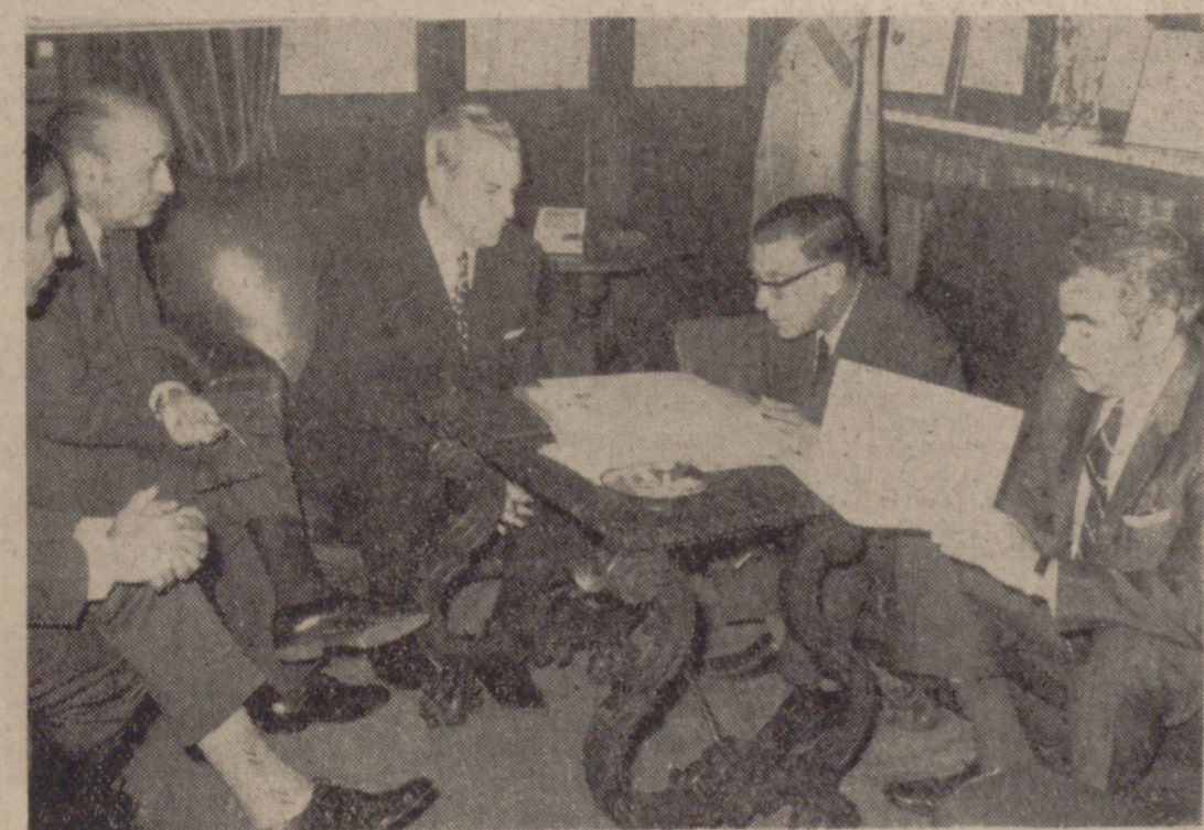
Un momento de la lectura de escrituras de adjudicación.

MADRID, 22. (Cifra). — A cerca de cuatrocientos veinte millones de pesetas ascienden los veinticuatro presupuestos de contrata de las obras cuyos concursos-subastas anuncia la Subsecretaría del Ministerio de Educación y Ciencia, según publica hoy el "Boletín Oficial del Estado". Según detalle: "Construcción de edificio para Archivo Regional de Valladolid, por 51.614.844 pesetas. Plazo de ejecución: veinticuatro meses."