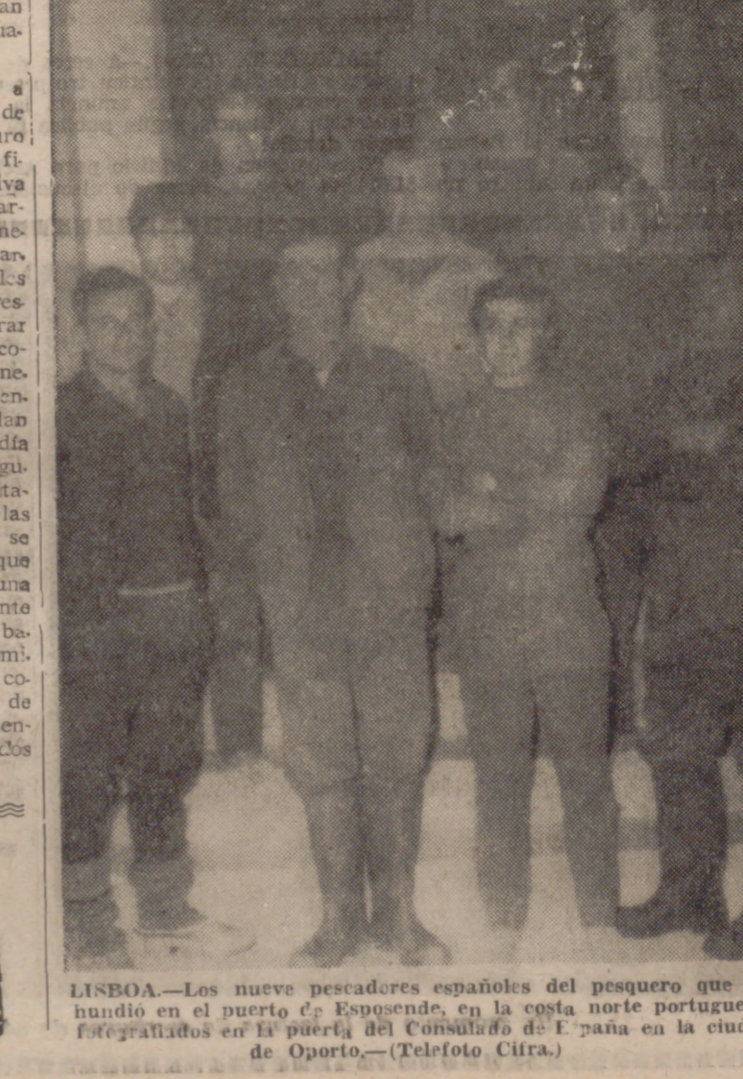
LISBOA.—Los nueve pescadores españoles del pesquero que se hundió en el puerto de Espinho, en la costa norte portuguesa, fotografiados en la puercía del Comercio de España en la ciudad de Oporto.