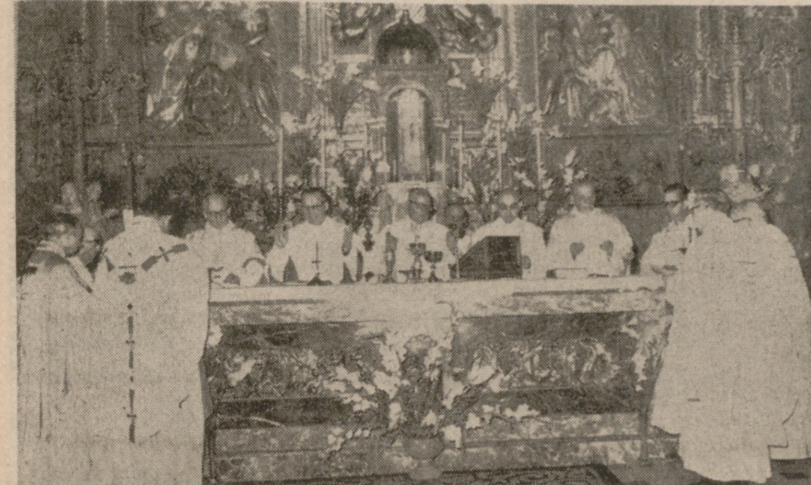
UN MOMENTO DE LA MISA CONCELEBRADA