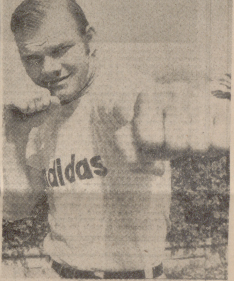
CASTELLDEFELS (Barcelona).—El boxeador alemán Blin fotografado en la terraza de su residencia en esta ciudad, donde espera para su combats del día 19 contra Urtain, en Barcelona.