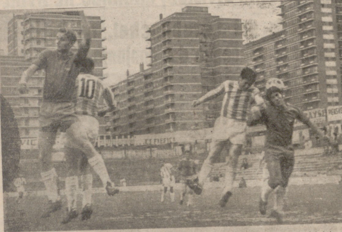
Geñupi, en pugna con un zaguero visitante, intenta cabecear un balón en el área del Aviaco.