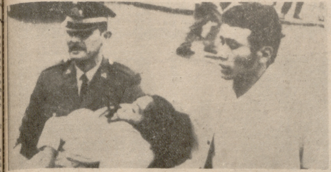
LIMA.—Una muchacha herida es conducida a una clínica. Resultó herida en las series de temblores de tierra que durante más de una hora se produjeron en las calles de Lima.