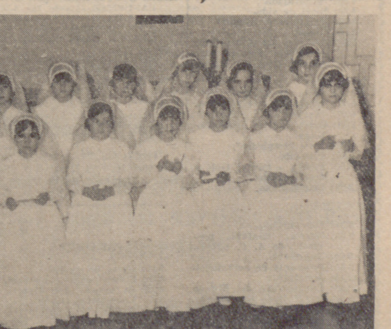
En el Hogar-Escuela "Gabriel Moyano", de "Auxilio Social", en Mojados, se ha celebrado el acto de administrar la Primera Comunión a varias niñas de este Centro...