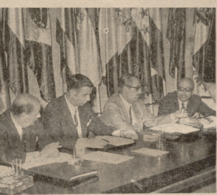
REUNION DE LA COMISION DE TIERRA DE CAMPOS