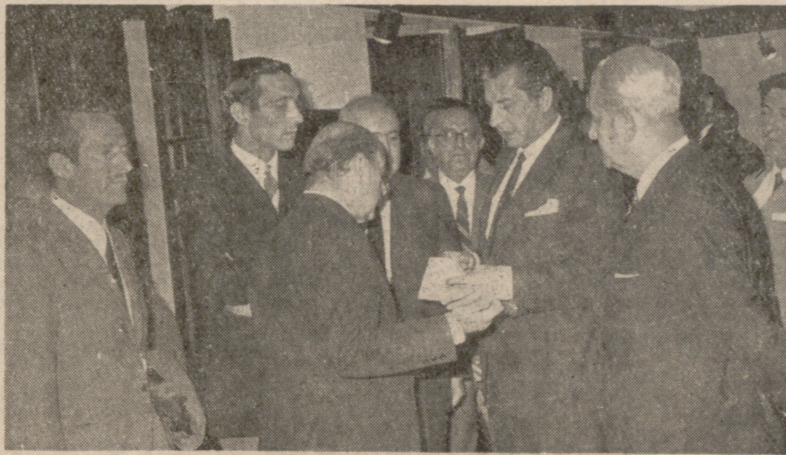
EL MINISTRO DE AGRICULTURA EN EL PABELLON DE VALLADOLID