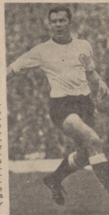
BECKEMBAUER (ALEMANIA): UN GENIO PARA DEFENDERSE

Franz Beckenbauer tiene 24 años, mide 1,81 metros y pesa 75 kilos. Si se exceptúa al legendario Walter y quizá a Uwe Seeler, es el jugador alemán mejor dotado por la naturaleza y uno de los primeros de Europa.