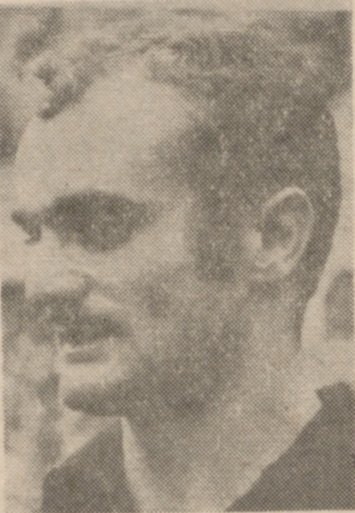
MAZZOLA (ITALIA): EL INCOMPATIBLE

Sandro Mazzola, hijo de aquel gran jugador Valentin Mazzola que murió en el accidente aéreo que asoló al legendario Torino, tiene 28 años, mide 1,79 y pesa 74 kilos.