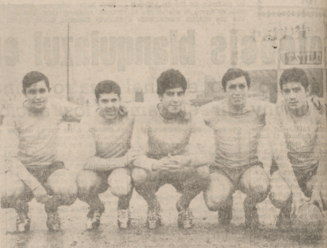
La vanguardia del Iscar, una de las líneas más destacadas del equipo, que marcha a la cabeza de la clasificación.

El sábado, en el campo de la Federación, victoria amplia de la U. D. San Carlos sobre el Tudela y escándalo final, provocado por los jugadores visitantes.