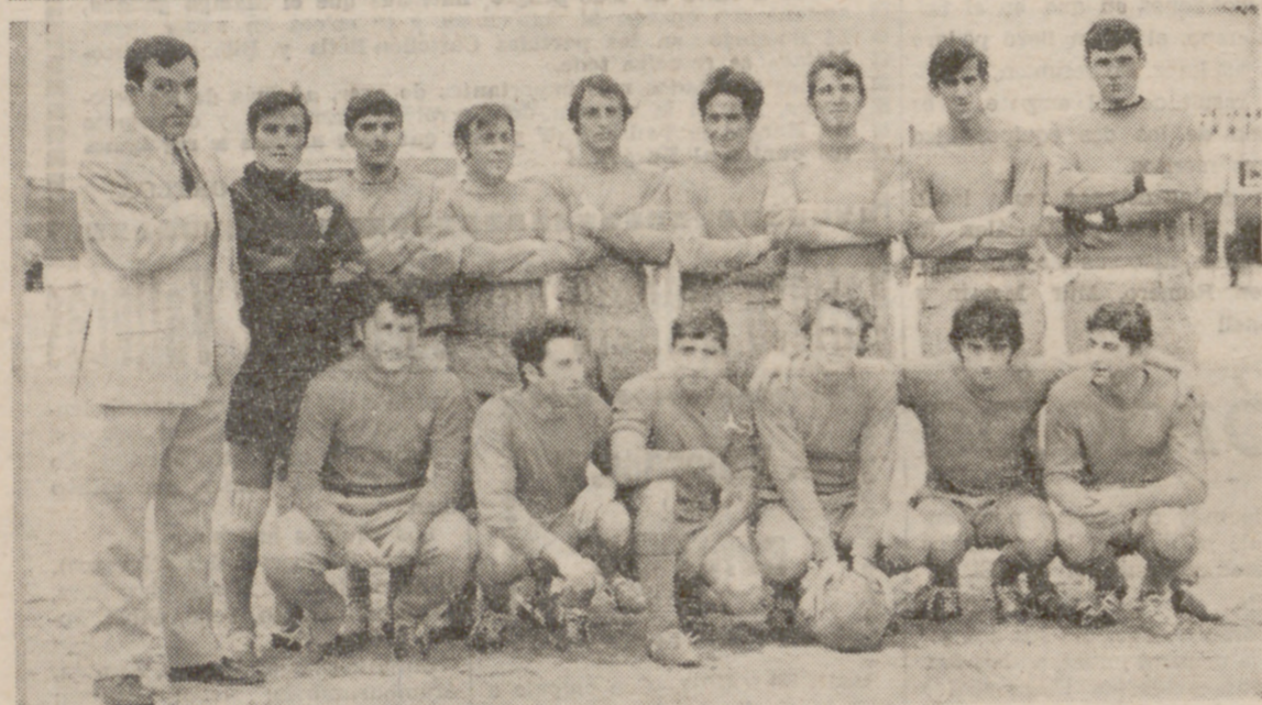
Real Valladolid e Instituto Nacional de Colonización, los conjuntos vallisoletanos que han tomado parte, sin éxito, en la fase de ascenso a Tercera. Ayer se repartieron los puntos en un encuentro sin relieve y apenas sin interés.

No han tenido los dos conjuntos vallisoletanos una actuación inspirada en la Fase de Ascenso, que ayer concluyó. Ambos han venido ocupando los últimos lugares desde las primeras jornadas y ambos cierran la clasificación, habiéndose mostrado claramente inferiores al resto de los competidores.