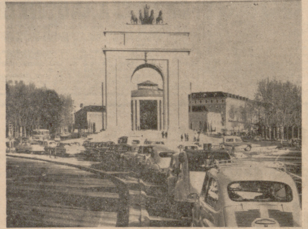
HACIA EL MERECIDO DESCANSO.

El ocio, aprovechado La Televisión y el «600» han transformado el ambiente familiar de los españoles