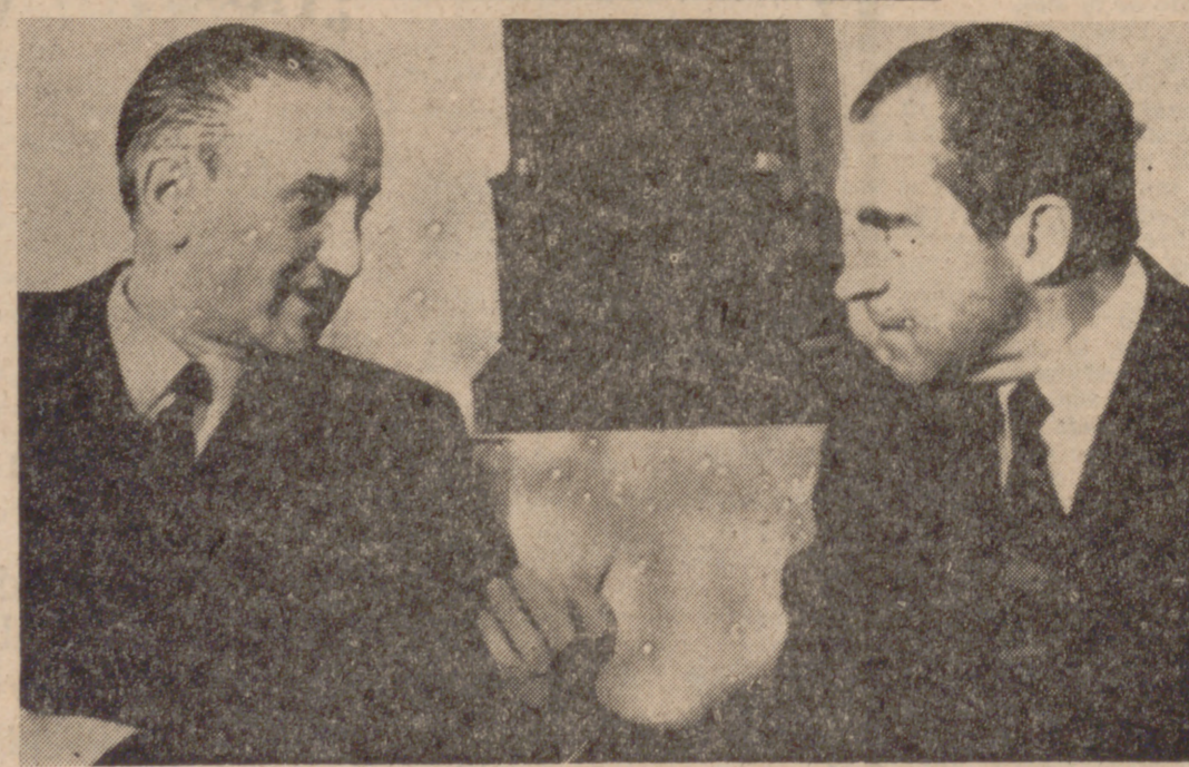
"LO PENSAREMOS MEJOR."

lado de la mesa, y entre éstos hay que destacar por lo menos a cuatro hombres. El primero, el propio Nixon, cargado con la última decisión, jefe indiscutible y única personalidad conocida entre todo su equipo. Viene en segundo lugar Melvyn Laird, secretario de Defensa, el hombre del Pentágono. El prudente William Pierce Rogers, secretario del Exterior, nesa aún más que el segundo en las decisiones presidenciales, y tampoco hay que olvidar al consejero Kissinger, "eminencia gris" del Presidente.