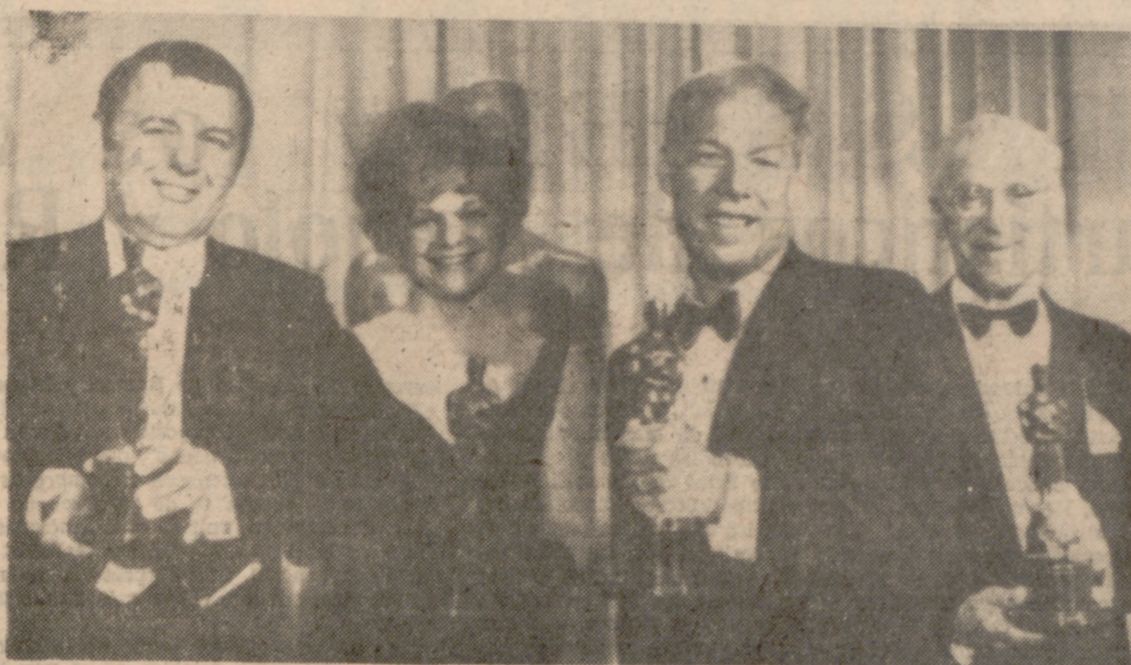
SANTA MONICA (California).—He aquí a los principales ganadores de los premios «Oscar» que anualmente concede la Academia Cinematográfica de Hollywood...