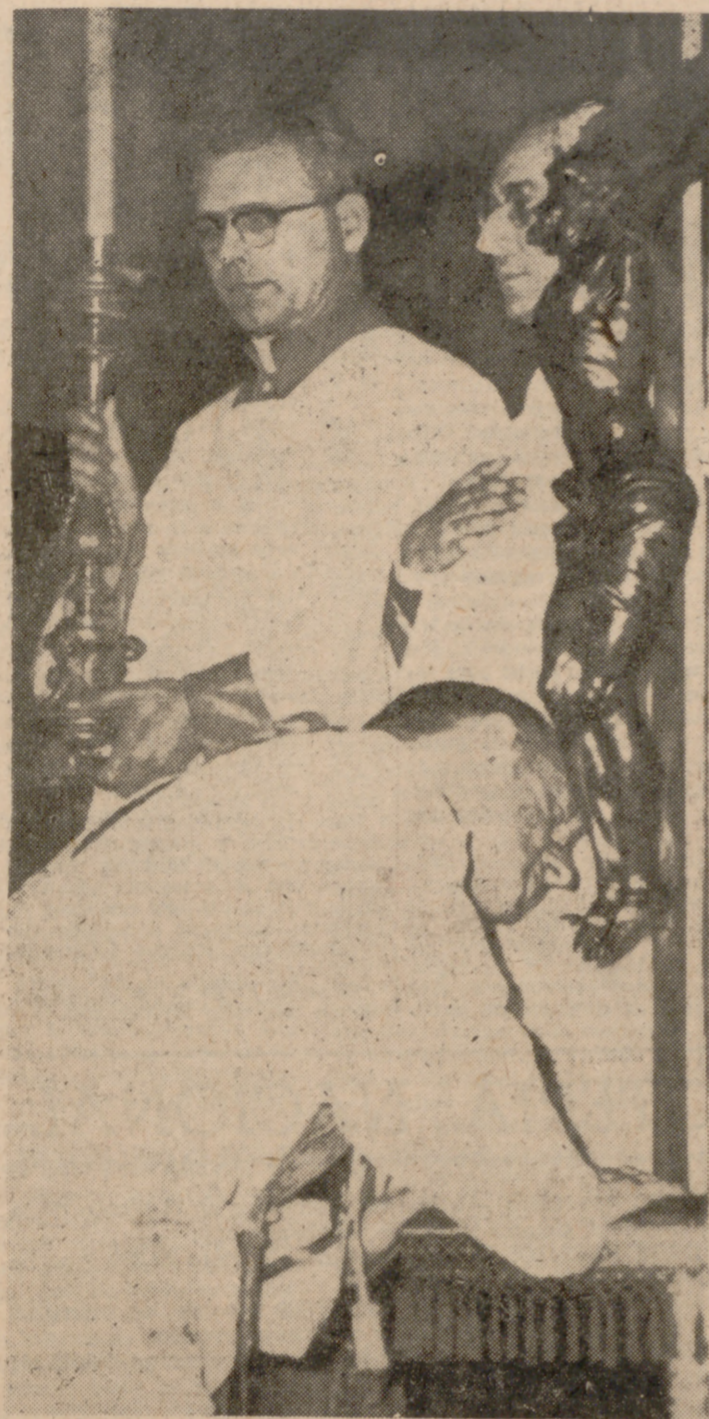
ROMA.—El Papa Pablo VI besa un Crucifijo en la Basílica de Santa María la Mayor durante los oficios.