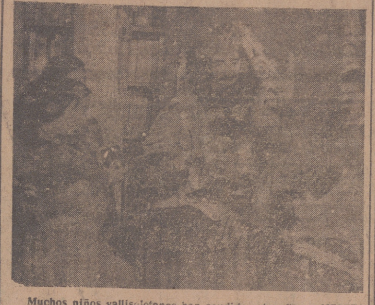
Muchos niños vallisoletanos han acudido estos días a MESETA para entregar sus cartas de pedido al Rey Melchor, a quien vemos aquí rodeado de infantiles visitantes, que fueron cariñosamente recibidos y obsequiados por Su Majestad.

ALDERON.—A las 4'45, 7'30 y 10'45. "El burlador de Castilla" (3). CAPITOL.—Continúa desde las 5. "Teatro Apolo" (3). CARRION.—A las 7'30 y 10'45. Espectáculo de Paquita Quintero. "A dos colores". (Despedida). COCA.—A las 5, 7'30 y 10'30. No-Do y "Hablan las campanas". (S. R.) GOYA.—Desde las 6. "Renegados" (3) y "Sangre torera" (3). LAFUENTE.—Desde las 6. "La Malquerida" (S. R.) y "Mujeres en la guerra" (S. R.) LOPE DE VEGA.—Continúa desde las 5. "Venganza tejana" (2) y "Camarada X" (2). PRADERA.—A las 5, 7'30 y 10'45. "Balarrasa". (S. R.) ROXY.—Desde las 5'30. "Esta noche y todas las noches". (S. R.) ZORRILLA.—Continúa desde las 3. "Los tres mosqueteros". (3).