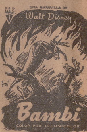
Bambi. COLOR POR TECHNICOLOR.