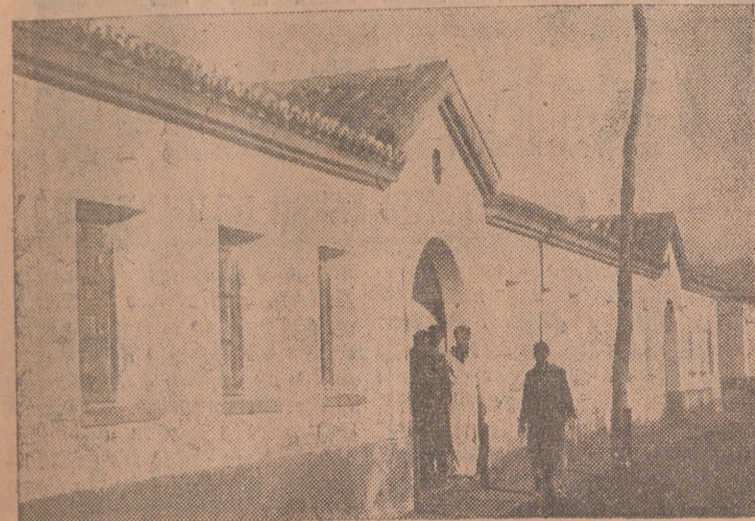
Grupo de viviendas "Orestes Redondo" entregadas en Sardon de Duero.