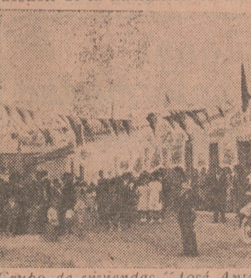
Grupo de viviendas "José Antonio" en Villán de Tordesillas.

EL PROBLEMA DE LA HABITACION Basta una ojeada a los temas del importante Congreso Internacional de la Habitación, celebrado en Berlín en 1931 para ver la inquietud de los Estados por dicho problema en un período en que la reconstrucción impuesta por la guerra del 14 les había permitido determinar los ensayos sobre sus respectivos países. Y basta también con observar la febril actividad con que los arquitectos, ingenieros y hombres de ciencia se dedican en la hora actual a planear sistemas y procedimientos novísimos para afrontar un problema de magnitud mundial.