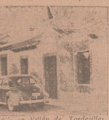
Grupo de viviendas "José Antonio" en Villán de Tordesillas.

Por otra parte, tan conocida es la influencia de las viviendas higiénicas y adecuada sobre la salud, la moral y la cultura de un pueblo que nos releva de repetir las innumerables sentencias verdaderas sobre este punto. He aquí dos estadísticas francas bien significativas. Una de ellas relaciona las defunciones registradas con el número de personas que corresponden por habitación en cada vivienda. En viviendas de cinco personas por habitación aparece un porcentaje de defunciones del 32 por 100; de cuatro personas por habitación, el 21 por 100; de dos personas, el 13 por 100; de una persona, el 5 por 100. La otra estadística indica los porcentajes de tuberculosos en París según los números de huecos y aberturas en la vivienda: en viviendas de una abertura por habitante, el 8 por 100; de dos a tres aberturas, el 5 por 100; de tres a cuatro, el 2 por 100;