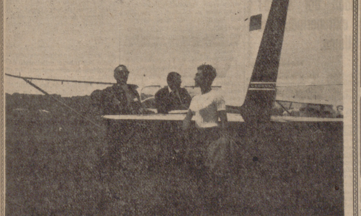
Tres participantes, una bella muchacha y dos caballeros, realizan las anotaciones de la ruta a seguir sobre el mismo ala de la avioneta. Son participantes de la Pequeña Vuelta Aérea a Europa, que viene desarrollándose sin novedad, y en la que toman parte destacados pilotos aficionados de España y de otros países europeos. Sobre el césped del aeropuerto francés de Toulouse, los participantes esperan el momento de efectuar el despegue a bordo de su avioneta y rumbo a cielos españoles. Esta vez, la próxima etapa es Tarragona, y se espera que puedan batirse buenas marcas. El tiempo es favorable y los ánimos de los participantes son excelentes.