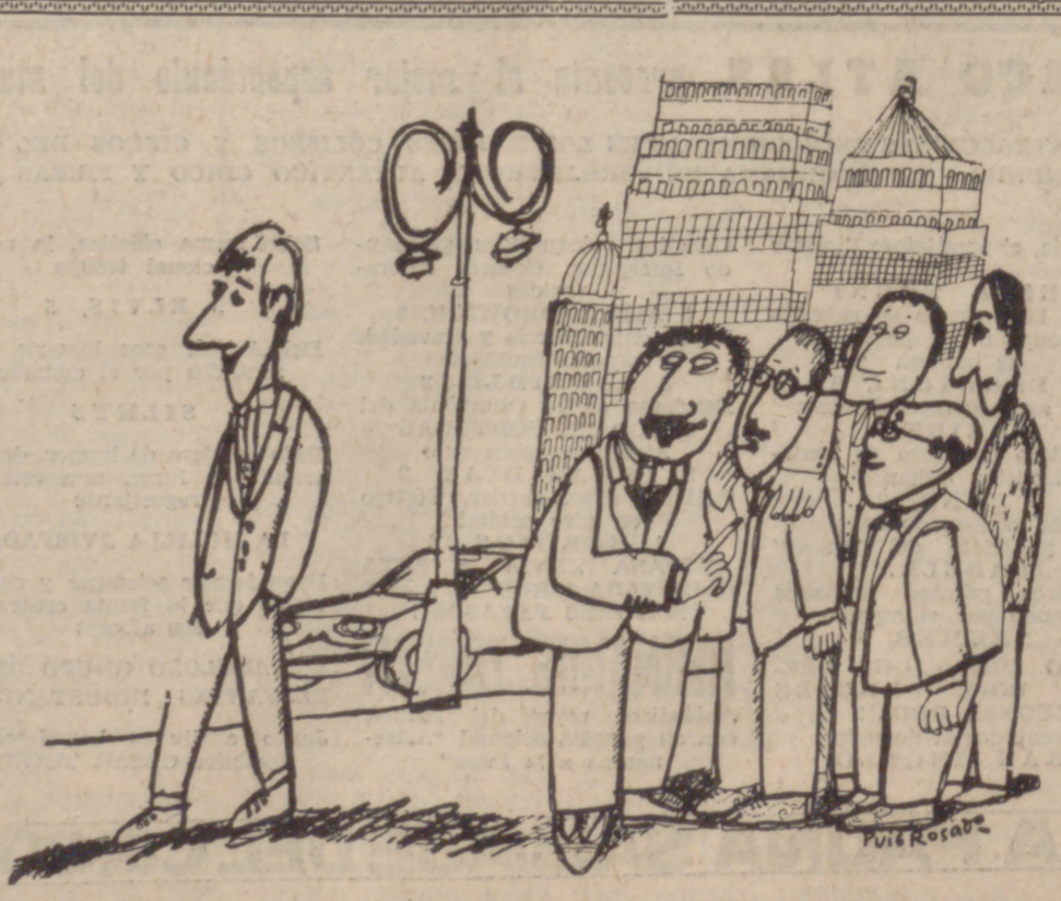
—Es la persona más patriota que conozco: Ama a España, a Francia, a Inglaterra, a Italia, a Alemania, a Suecia, a Yugoslavia, a Finlandia...

«GO DE G EN» M H A pro organiza tica", a l camino política ro, al m ciones, q muy ace sibilinas, nocer pr pálga, es lógica, n nal, las del statu terminad sobre to apunta c taciones organ que sea en una d al tiempo renuncia tendrá q presencia, otros ra consecue cia de u política cia. H ACI la to mo se e los debat ro, desgr camino e el cual y pamente, del Caud millones democrá ción a F VUELO DE PARIS zar en el get. mos nos Her do) y de chando Igor Sik licóptero Unidos fondo d haber po dos hast ruta sen por Cha Asi han trasatán (Te L AYE Y K MADRID de la l de la sesión de debate del Movimie interviene Bueno. Se re las habidas que el es basa en el Nacional y nos de aisl cional. El M partido, es n de los espa grande. La Movimiento a los procu dad. El señor C intervención Fernández C claró el am que sierv ción por s yo y que t continuidad porta su sin que hay un puede tener var que la es desarr de la Ley haga en d recece bien, concorde con Importe lonelada MADRID, expectacion e año pasa lanadas. E controló u grupo de In del Sindicat sindicación.