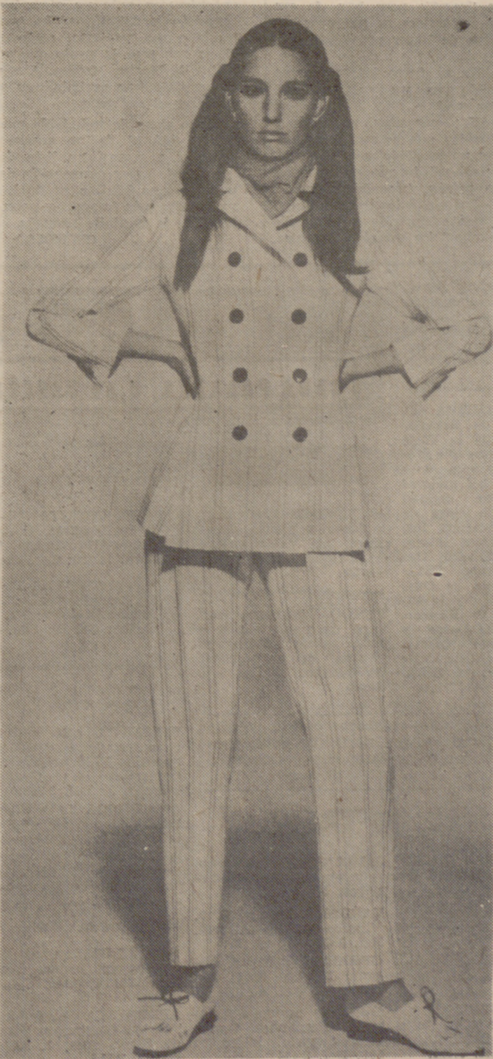
Conjunto chaqueta pantalón en ARNEL, en fondo blanco y rayado negro.