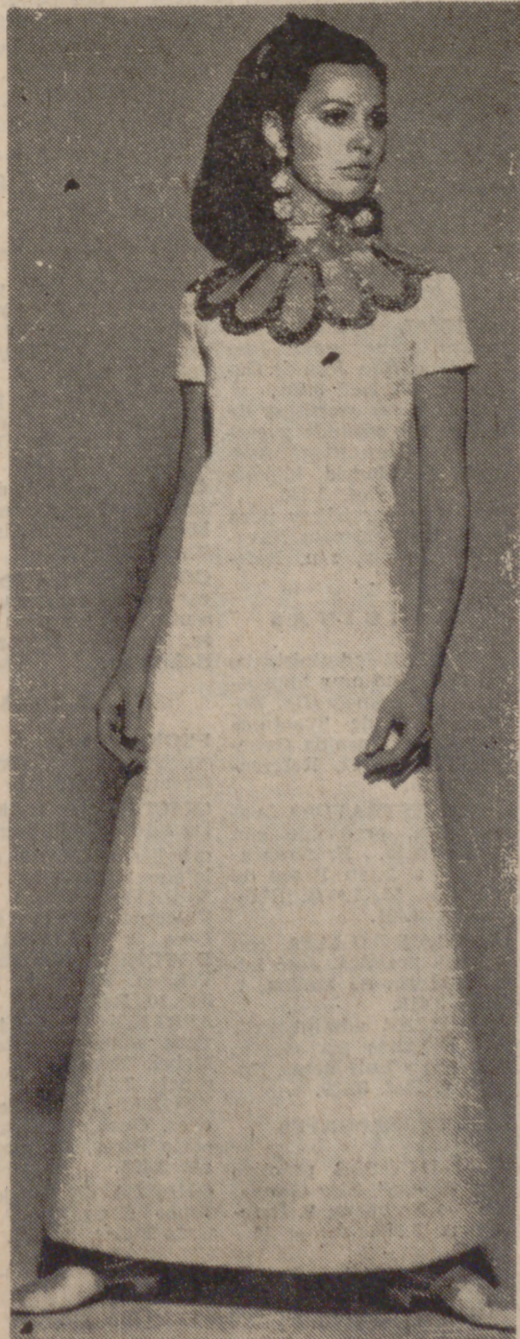
Traje de noche largo en crepé ARNEL "play girl" amarillo chartreuse y blanco, de Castillo.

¿Y los hombres? Intencionadamente se les preguntó qué falda les gustaba más entre las muchachas jóvenes. Y he aquí el resultado: Un 57 por 100 desearía ver tapada la rodilla femenina; esto es exactamente el mismo tanto porcentual que el de las jóvenes (entre dieciséis y veintinueve años) que se decidieron por la falda larga. Con ello creemos que todo marcha a pedir de boca, al menos desde el punto de vista de la estadística.