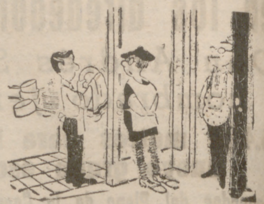
—Es el vecino del segundo. Dice que si le puede usted prestar un estropajo.

HORIZONTALES.—1: Al revés, letra griega. Al revés, pronombre. 2: Al revés, apócope de malo. En plural, antiguamente aféresis de sabe. 3: Nota musical. Reduce a una sola cosa. 4: Planta umbelífera. 5: Ciudad de Colombia. Animal salvaje parecido al bisonte. 6: Agudo. Allano. 7: Asidera. Al revés, cura. 8: Cubria de losas. 9: Reparara un buque. Al revés, afirmación. 10: Arbol de bebida refrescante. Al revés, prenda militar. 11: Campeón. Símbolo del calcio. VERTICALES.—1: Cuchillo corto. 2: Onda. Une. Aquí, 3: Símbolo químico. Allanaras. 4: En plural, relativo a la música. 5: Negación. Al revés,