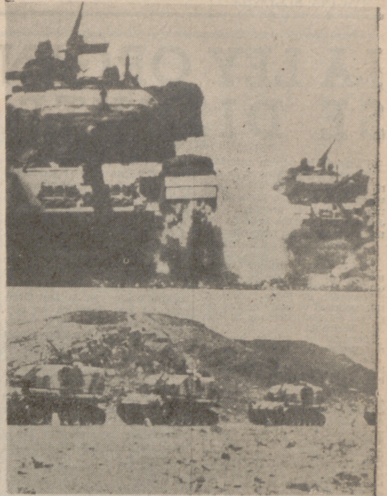
ISRAEL.—Unidades de una agrupación de tanques del Ejército israelí durante sus entrenamientos en un lugar del sur del país. Diariamente se llevan a cabo estos ejercicios bélicos, mientras la tensión continúa a lo largo de la frontera. Abajo, grandes tanques jordanos se dirigen hacia el lado occidental de Jordania, cara a Israel, como parte de la movilización general del país.