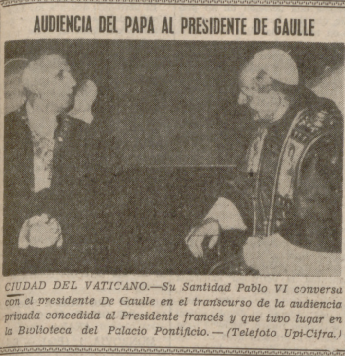
CIUDAD DEL VATICANO.—Su Santidad Pablo VI conversa con el presidente De Gaulle en el transcurso de la audiencia privada concedida al Presidente francés y que tuvo lugar en la Biblioteca del Palacio Pontificio.

LONDRES, 1. (PYRESA).—El «Times» destaca una crónica de su corresponsal en Madrid bajo el título: «España actúa como intermediario», en la que afirma que España «emerge nuevamente como un importante canal de comunicaciones en los esfuerzos diplomáticos para suavizar la crisis de Oriente Medio». En dos ocasiones —añade la información— al menos durante las setenta y dos últimas horas, los dirigentes árabes han usado este canal para enviar importantes puntos de vista de Washington. Uno de los mensajes era una comunicación personal del Presidente Nasser al General Franco, en la que destacaba que El Cairo considera que está en su de-