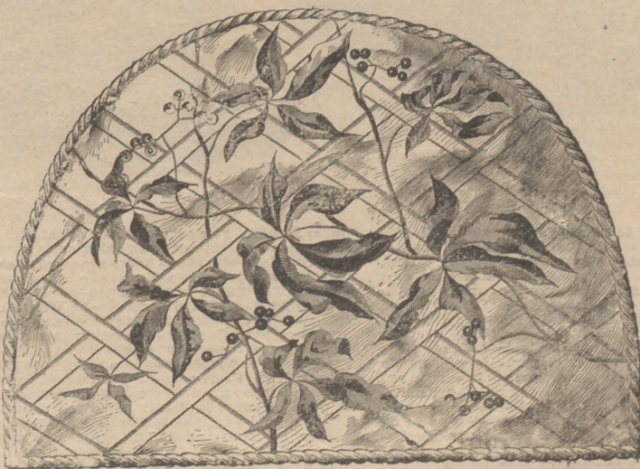
5. La Viña de Judea: cubre-tetera, dibujo decalable sobre toda clase de tejidos.