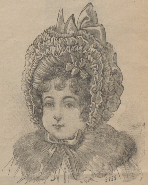
3. Capota para niño de 1 á 3 años