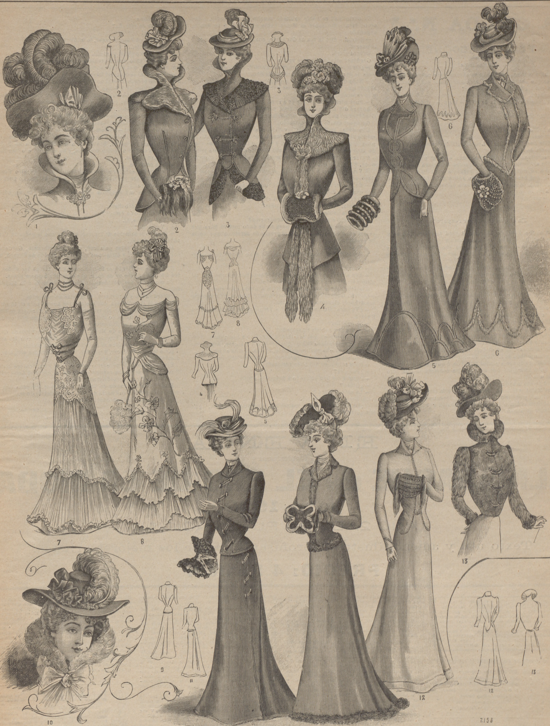
8. Toilettes de baile y trajes sastré. 1. Sombrero de fieltro negro, guarnecido á izquierda con un lazo de cinta coral. Grupo de plumas negras. 2. Chaqueta de paño tabaco, ajustada por delante; grandes solapas onduladas cubiertas de vison, cuello Médico. Mangas montadas sobre un jockey, guarnecidas de junquillos picados. Mat.: 2.40 m. paño. 3. Chaqueta de paño rojo indio, cerrada por sardinetas. Cuello Médico. Esclavina redonda completamente cubierta por un collet de vison, y terminada en dos largos faldones sujetos por choux de terciopelo. Cuello Médico dentado. Mangas lisas. Esta chaqueta es de paño verde botella adornada de vison. Mat.: 2.70 m. paño. 4. Traje de sarga azul marino, falda lisa, adornada de junquillos picados formando dibujos en los lados y delante. Cuerpo igualmente adornado, ajustado delante y en la espalda, cerrándose en lo alto por un solo botón. Cuello sastré. Mangas guarnecidas de junquillos. Mat.: 7 m. sarga. 5. Traje de paño negro falda ajustada, guarnecida de vison formando puntas. Cuerpo entallado, compuesto de espalda, costadillos y delantero ajustado por dos pinzas. Cuello sastré fantasía, adornado de piel, prolongándose por delante y todo al rededor. Mangas adornadas de piel en el bajo. Manguito de nutria, guarnecido de seda blanca. Cuello drapeado. Cinturón de gró. Mat.: 7 m. paño. 6. Traje de muselina de seda rosa. Falda formada por dos volantes de muselina de seda orlados de una ruche montada en un canesú de guipure con viso de seda rosa. Cuerpo drapeado de muselina de seda. Rodean el talle tres cintas de terciopelo negro, anudadas por delante. Pequeña torera de guipure sujeta por dos hombrillos de terciopelo atados. Guantes blancos de Suela. Mat.: 6 m. muselina de seda, 12 m. tafetán. 7. Toilette de seda paja y muselina de seda blanca. Falda redonda, ajustada, con flores bordadas en relieve, adornada de tres volantes de muselina de seda, dos de los cuales están dispuestos formando puntas sobrepujadas por pequeñas ruches de aciosos pomiers adornadas con las cadenas. Cuerpo entallado guarnecido de bordado por delante. Cinturón drapado de muselina de seda. Guantes blancos de Suela. Mat.: 13 m. seda, 10 m. muselina de seda. 8. Traje de cheviotte rojo indio. Falda ajustada de sardinetas. Cuerpo ajustado. Cuello solapas, adornado de pespunte, seguido de sardinetas y botones como en la falda. Mangas lisas. 9. Gran sombrero, forma bergère de fono alto guarnecido de bonita amazona blanca y drapería de terciopelo rojo graciosamente arrugada. 10. Traje de paño aceituna. Falda ajustada, forrada de silesiana y orlada de una canefa de vison. Cuerpo entallado con falda redonda. Cuello solapas ornado de piel. Mangas con carters de piel. 11. Traje de paño mástic. Falda redonda completamente lisa en cenefitas de seda pekinés negra y blanca, cuerpo de faldón redondeado en delantero y espalda, con orla de seda pekinés. Los delanteros van cerrados por corchetes. Cuello sastré. Mangas lisas. Canesú de seda blanca. Cuello drapeado. Cinturón de gró. Mat.: 7 m. paño, 3 m. pekin. 12. Torera de nutria cerrada delante por sardinetas sujetas por botones. Cuello Médico. Sombrero redondo de fieltro negro, adornado de plumas.

La Debilidad nativa, el Linfatismo, el Escrofulismo, las Menstruaciones difíciles y la Obesidad, las cura el VINO GIMBERNAT , Iodotánico Fosfatado.—8 reales.—Asaito, 14.—Barcelona GRANDES ALMACENES Y TALLERES DE MUEBLES, TAPICERÍA Y CORTINAJES DE JAIME HOMS, PELAYO, 50, BARCELONA