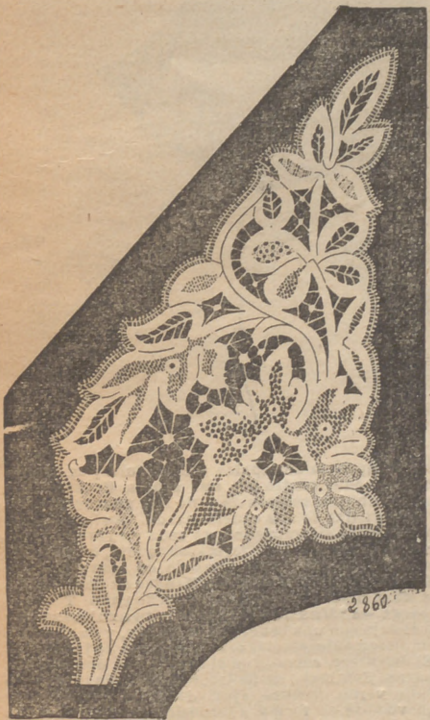
4. Solapas de encaje Renacimiento para guarnición de cuerpo.