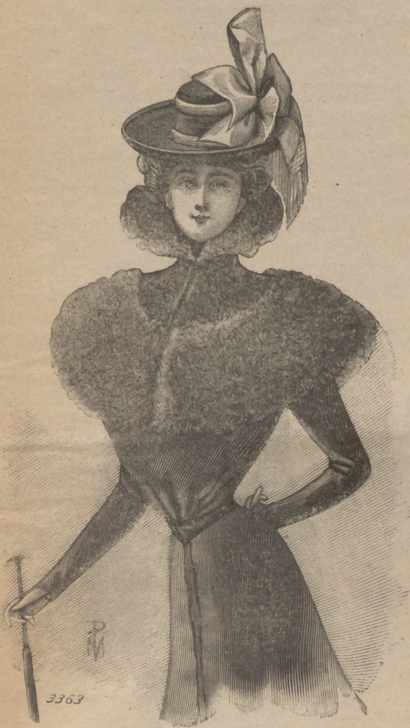
2. Sombrero alta novedad: Cuello Mercedes.

6. Entredós de encaje Renacimiento para guarnición de blusa de jovencita, falda y cuerpo. Este modelo es del todo encantador con sus trenchillas caladas con piquillos y sus medallones cortando la uniformidad de una reñeta recta. Parece un verdadero encaje y constituirá la más hermosa guarnición para blusa, delantal de niño y de jovencita, falda y cuerpo de paseo. Compónese de una trenchilla calada unida á otra trenchillita con piquillos que forma el borde, por decirlo así, del encaje, cuya parte central va adornada de una línea de medallones en trenchilla del más rico efecto, los cuales se unen entre sí por medio de barretas venecianas que se obtienen lanzando dos hilos del medallón en la trenchilla, y sobre los cuales se vuelve volteando en zigzag el hilo trabajador sobre estos dos hilos lanzados. La ruedecita se hace pasando la aguja por encima y por debajo de los hilos como en el punto de zurcido. El interior de los medallones va adornado con calados de la mayor sencillez y que todas nuestras lectoras, muy iniciadas en este lindo encaje, conocen de largo tiempo. Los anillitos ó ojitos que forman el corazón de la flor se compran hechos; así pues este trabajo, rápido á la vez que ameno, es á propósito para las más pequeñas manos. El croquis n.º 8049 representa el detalle del bordado.