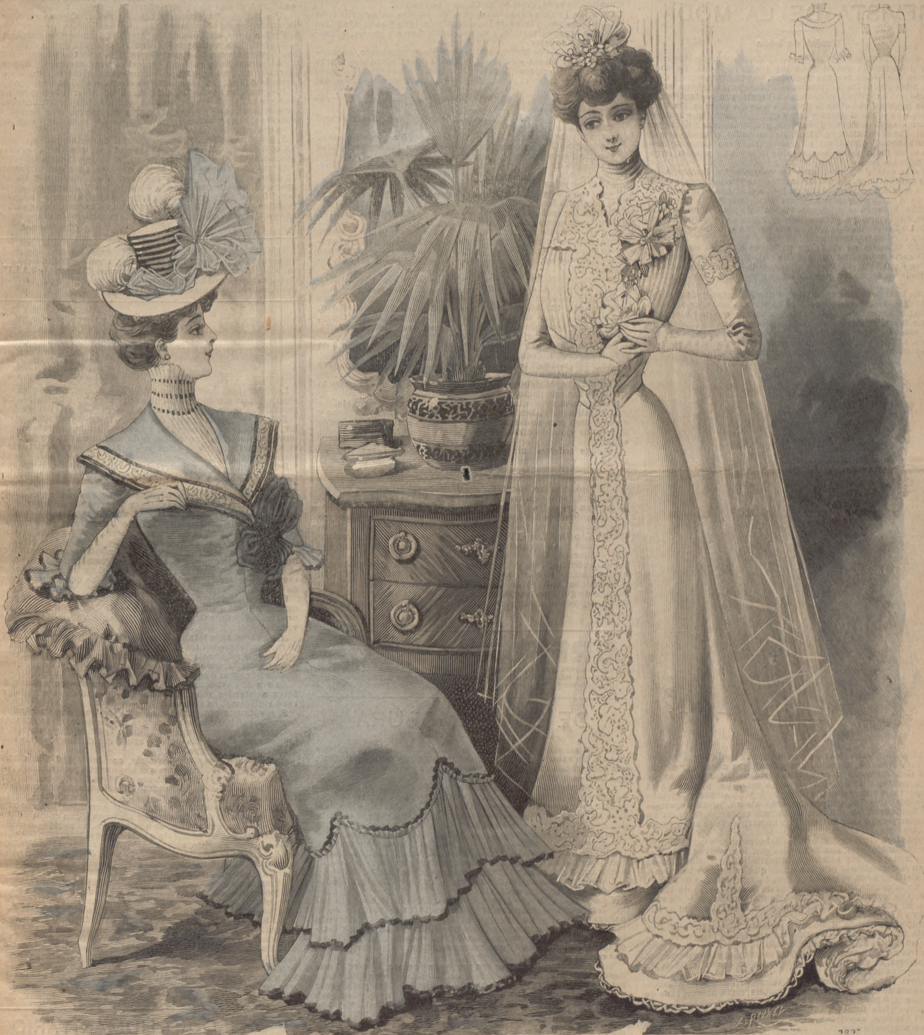
1. «Toilettes» para novia y madrina de boda.

15 NUMERO SUELTO céntimos en toda España