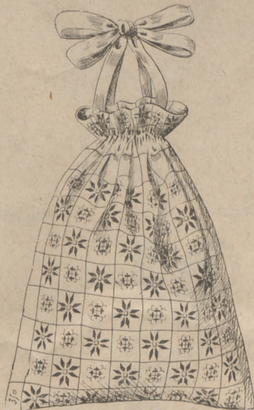
3. Saco de nodriza en tela de los Vosgos.