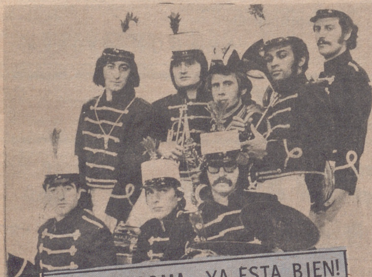
¡COMO BROMA, YA ESTA BIEN!

S IEMPRE que se ha preguntado a alguna personalidad de los cuadros dirigentes de T.V.E. por la razón de que los programas musicales no se graben con la actuación en directo de los artistas invitados, se ha respondido que el empleo del "play-back" tiene por misión el conseguir un auténtico buen sonido, que de otro modo sería muy difícil lograr. Como explicación, no es que tenga mucho peso porque en última instancia habría que dudar en la competencia, del equipo de técnicos de sonido que tiene nuestra televisión pero podría ser admitida. Sin embargo, he aquí, que después de escuchar