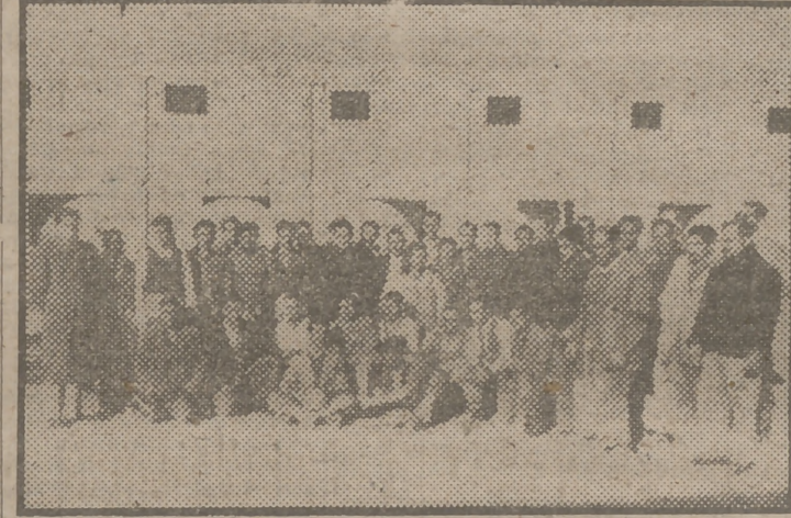
Los albañiles que trabajan en la Ciudad del Aprendiz rodean al gobernador civil de Valencia, Diego Salas Pombo, y al Delegado Nacional de Sindicatos, Fermin Sanz Orrio.

arrasado y derruido. Las postreras piedras que se colocan al edificar, junto con las banderas a modo de kikirikis encima de los tejados, contienen una cronología datada desde 1936 en adelante, cuando sobre la España prehistórica y la España celtibérica, y la España romana, y la España renacentista, y la España barroca, y la España neoclásica, España sus puertas, y acaso nunca asimilables, se está gestando y gestionando la España que entrará en el segundo milenio de Cristo. La España capaz de resistir ante los terrores del nuevo milenario.