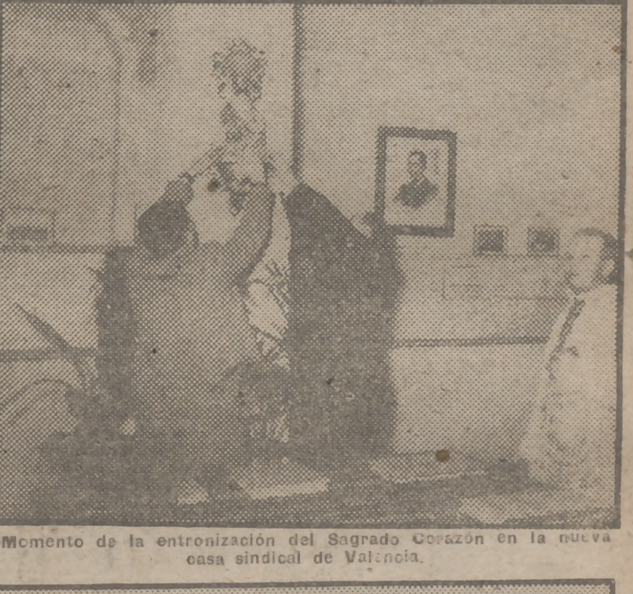
Momento de la entronización del Sagrado Corazón en la nueva casa sindical de Valencia.