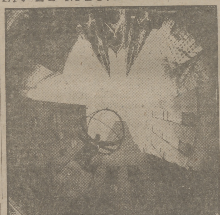
Las fotografías obtenidas con objetivos de 210 grados de campo parecieron un imposible hasta la fabricación de lentes planos, llevada a cabo por los alemanes mediante redes de difracción. En esta prueba se ven los cuatro puntos cardinales de la ciudad en una visión de impresionante irrealidad.