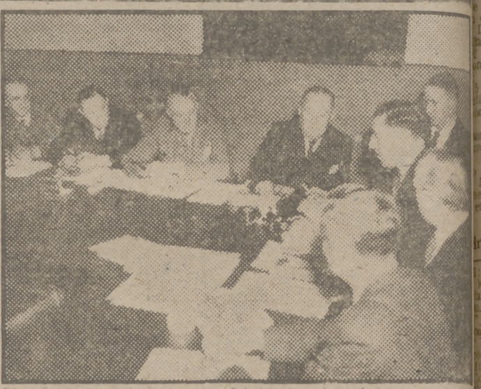
El más importante grupo de fabricantes de aviones y motores a reacción en Inglaterra se reúne para estudiar y coordinar sus esfuerzos para la defensa de la Europa Occidental.

BY AIR MAIL ★ PAR AVION POR AVION VIA AEREA ★ FLUGREIFE