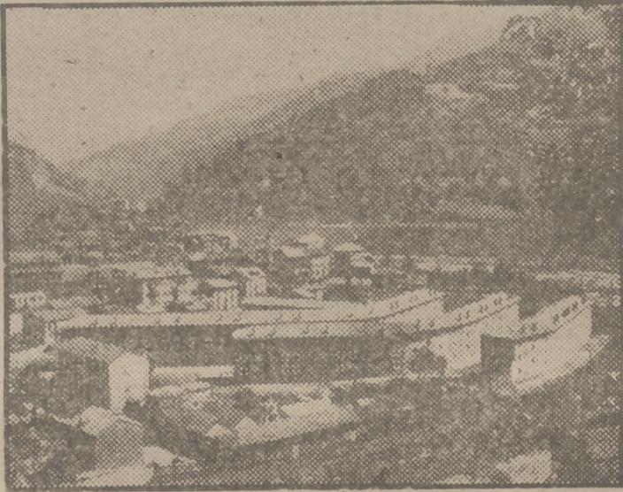
Perspectiva del magnífico grupo de viviendas protegidas para mineros, construido en Lada

La lista de empresas de todo tipo que se lanzan a la construcción de viviendas sería extensísima, y por ello nos dispensamos de enumerarlas.