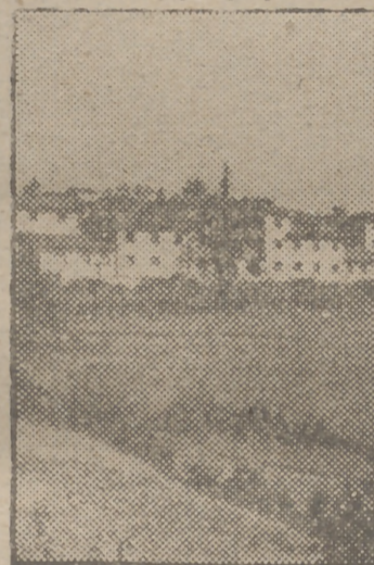
Alegre poblado minero de Pando, levantado por el Instituto Nacional de la Vivienda

Para llevar a cabo este plan hubieron de superarse innumerables dificultades provenientes de la apatía de los emplazamientos, abastecimientos de agua, etc. Labor meditada y prolija que el Ins-