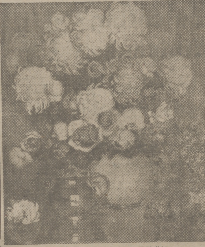
"Flores", óleo original de Juan Girádez.