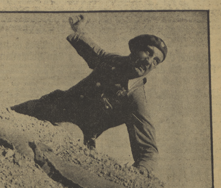
Arroja la bomba que escupe metralla...

Méjico, 12.—La censura mejicana ha prohibido la proyección de fotografías de Hitler y de Mussolini y de toda clase de films en que aparezcan los insurrectos españoles. El secretario de Estado en el Interior aprobó un reglamento permitiendo a la censura prohibir parcial o totalmente los films consagrados a obras sociales o educadoras de los gobiernos de ideología totalitaria, contraria a la de Méjico. Esta propaganda está destinada a combatir la de los fascistas mejicanos, que aprovechan cualquier ocasión para exaltar ideas de carácter fascista.