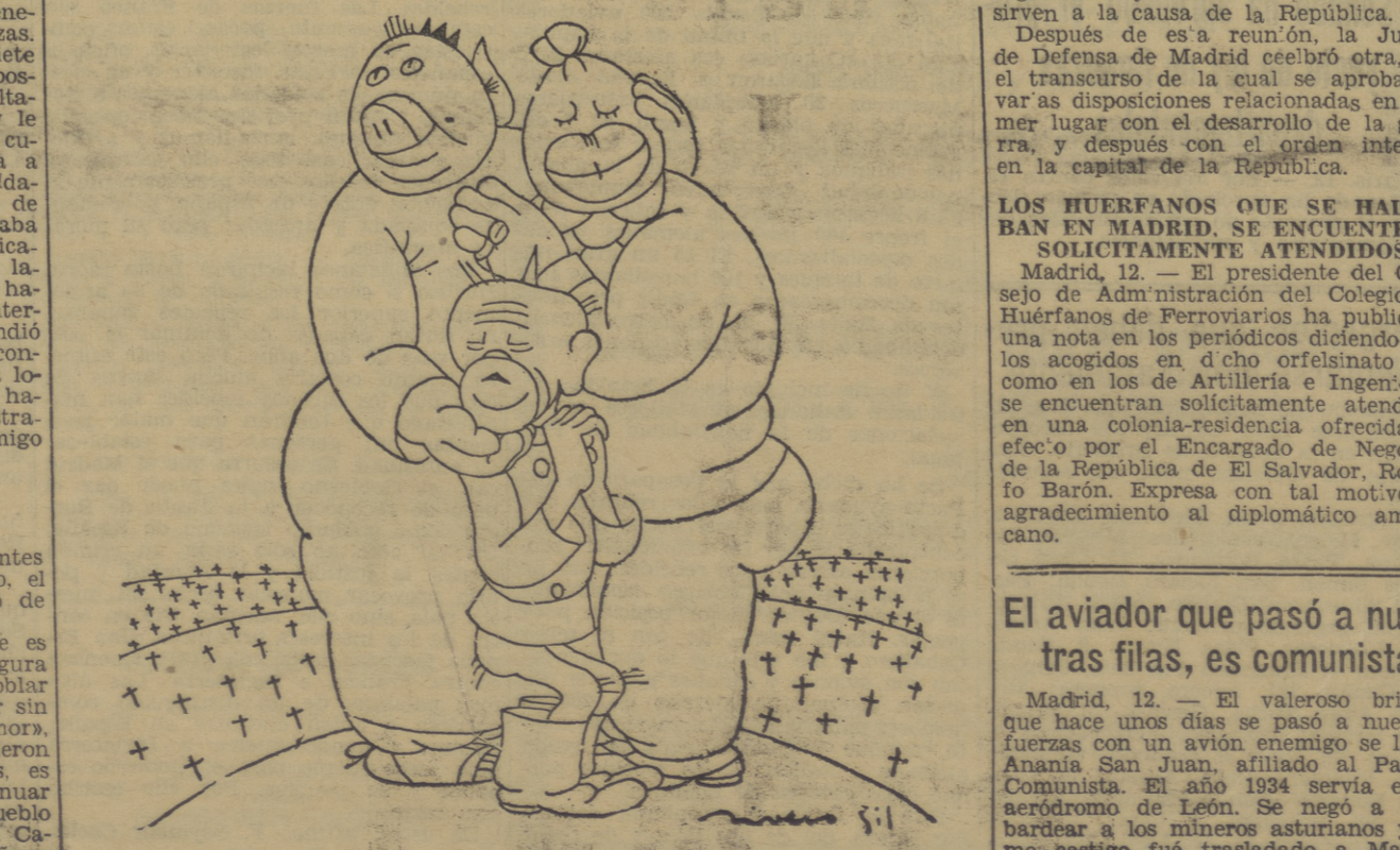
Ideales fascistas. — ¡Al fin, sojuzgado!