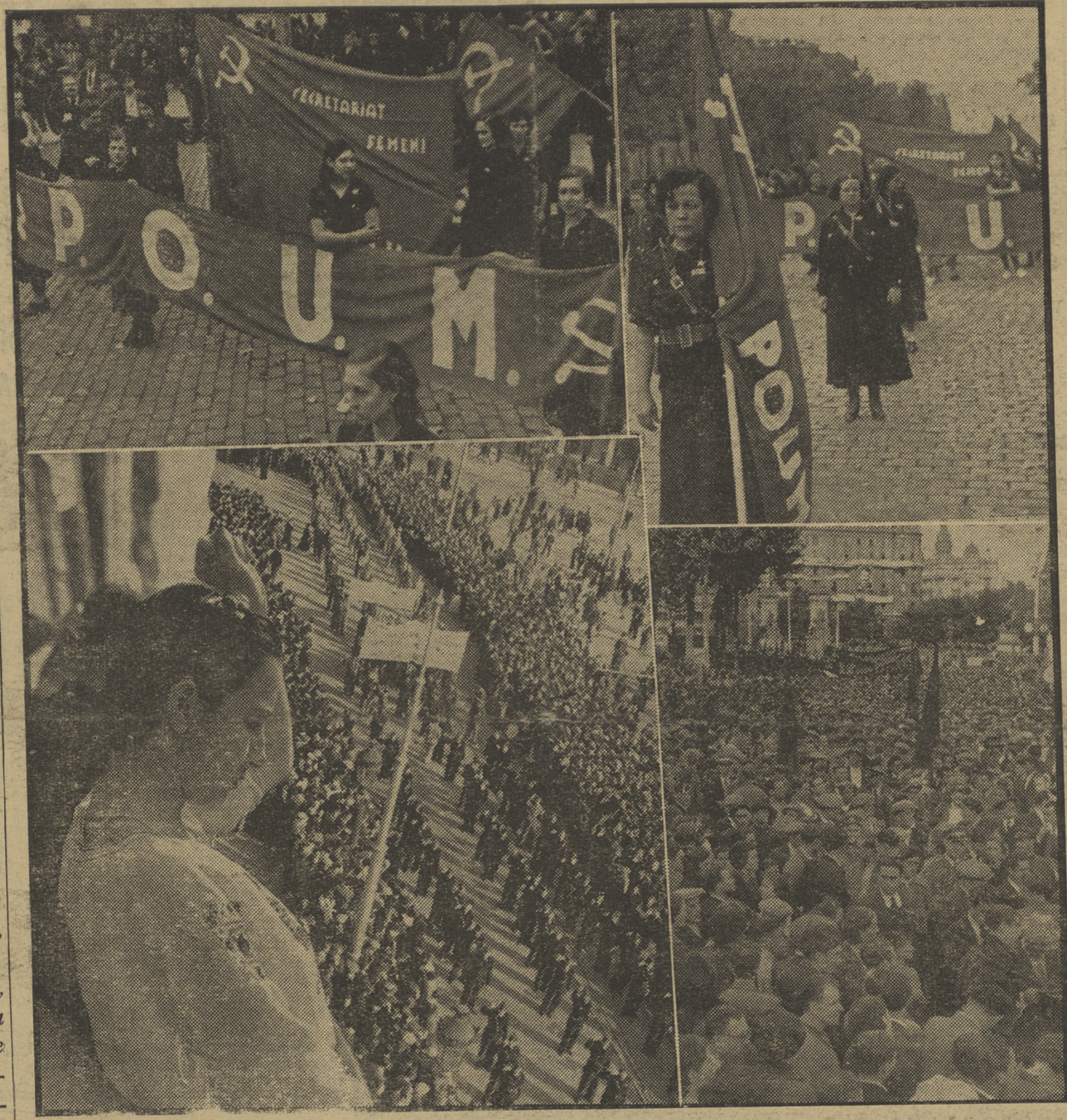
Varios aspectos de la manifestación del pasado domingo. En las fotografías podemos ver a la representación femenina del P. O. U. M.

“La mejor defensa de la U. R. S. S. es hacer la Revolución en Iberia”, decía una de las pancartas del P. O. U. M.