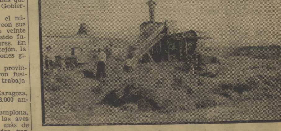
En el frente, se lucha y se trabaja. Hagamos lo mismo en la retaguardia!

«Acaba de constituirse en Madrid la Junta de Defensa. Las circunstancias exigen su constitución. Casi todos los trabajadores están en ella representados. Cuando la P. A. I. y el P. O. U. M. pasen a constituir parte de dicha Junta, es indudable que el entusiasmo re-