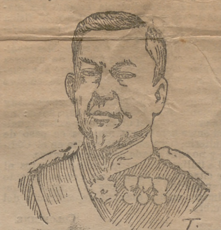
Mariscal Oyama Jefe de Estado Mayor de los ejércitos japoneses

Entre estas consideraciones figura y se le concede cierta importancia á la opinión de altas personalidades entendidas por sus