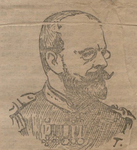
Almirante Skrydlov Jefe de la escuadra rusa del Pacífico

Impresiones del día Hoy como ayer y anteayer continuamos sin noticias concretas del teatro de la guerra, pues es tal la confusión que resulta del farrago de versiones contradictorias que publica la prensa, procedentes en general de los centros de información de Londres y muy especialmente de los periódicos británicos y neoyorquinos, que es imposible de todo punto aproximarse siquiera á la verdad al pretender narrar los acontecimientos que se desarrollan en el Extremo Oriente.