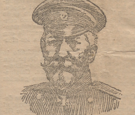
El general ruso Krastelinsky que manda las fuerzas que avanzan en Corea al encuentro de los japoneses

«Cada vez—dice—que los japoneses entran en fuego, se hacen acreedores á los más entusiastas y unánimes elogios por su bravura, su desprecio del peligro y su calma estóica ante las balas enemigas. Los japoneses desprecian siempre la adaptación de los sistemas de formaciones modernas