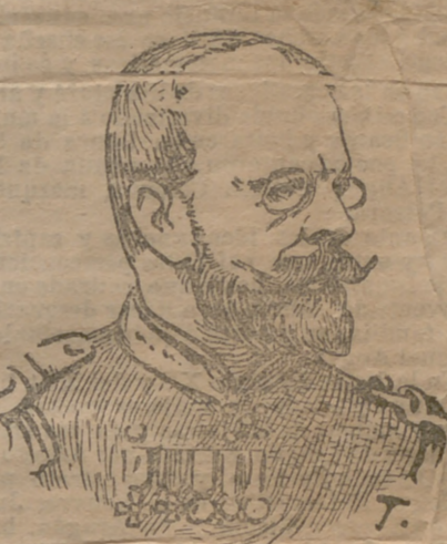
Almirante Skrydlov Jefe de la escuadra rusa del Pacífico