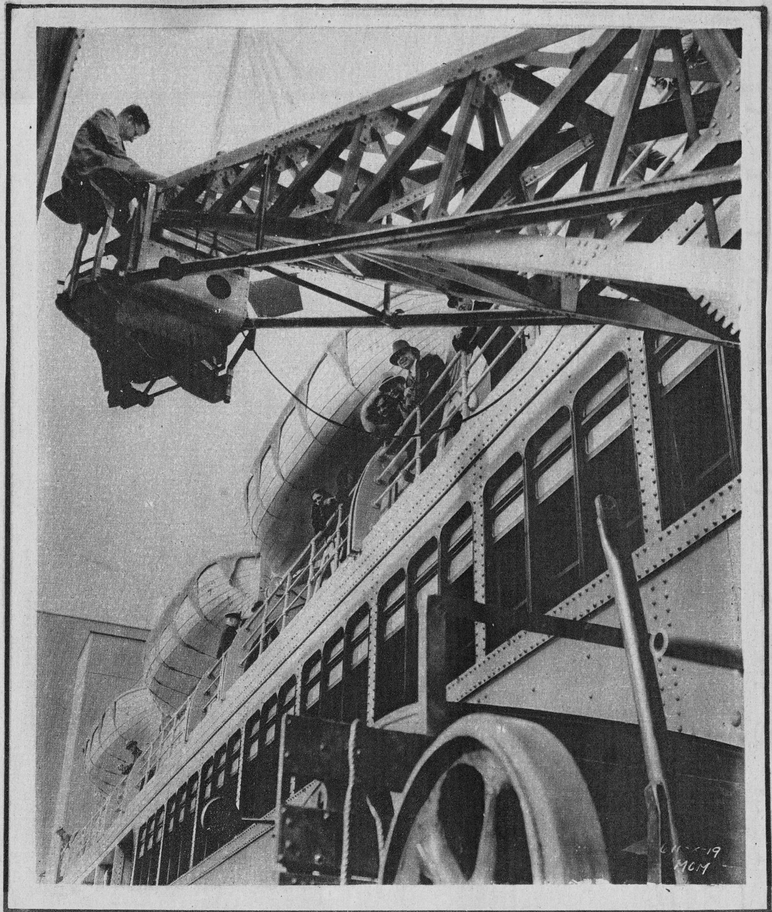
Joan Crawford y Robert Montgomery, con un grupo de actores y empleados de la M. G. M., filmando una escena