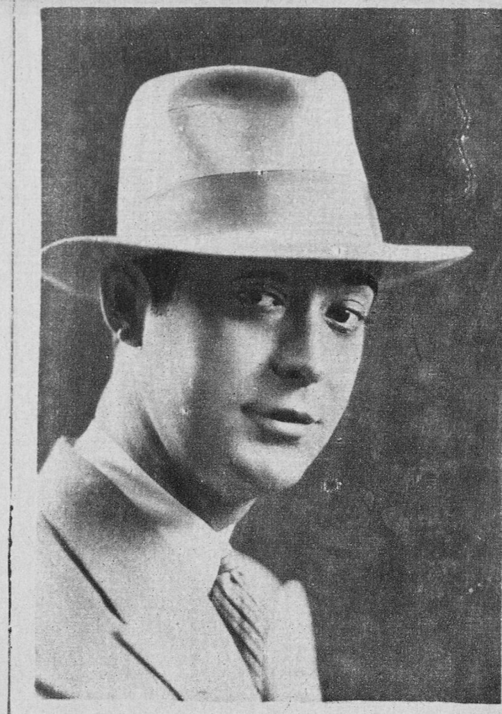
José Alcántara, galán de cine, que va a Berlín para rodar tres películas en español

Le vi un día partir por la ruta gloriosa de los conquistadores, con los ojos sedientos de plata y azul, fijos en el horizonte, tras el magnífico fulgor de una estrella lejana. Y al alejarse la nave del puerto, senti que en el fondo de mi corazón se escondían, intensas, las emociones.