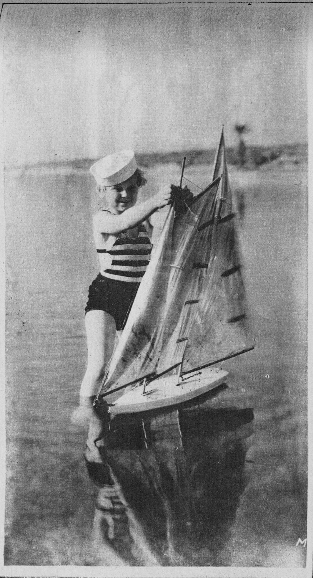
Jackie Cooper, se divierte e instruye en la playa de Santa Mónica, aprendiendo, con este bote en miniatura, los rudimentos de la navegación

Por esto podemos decir, que, como ya hemos afirmado al comenzar, el cine infantil aumenta en información cada día.