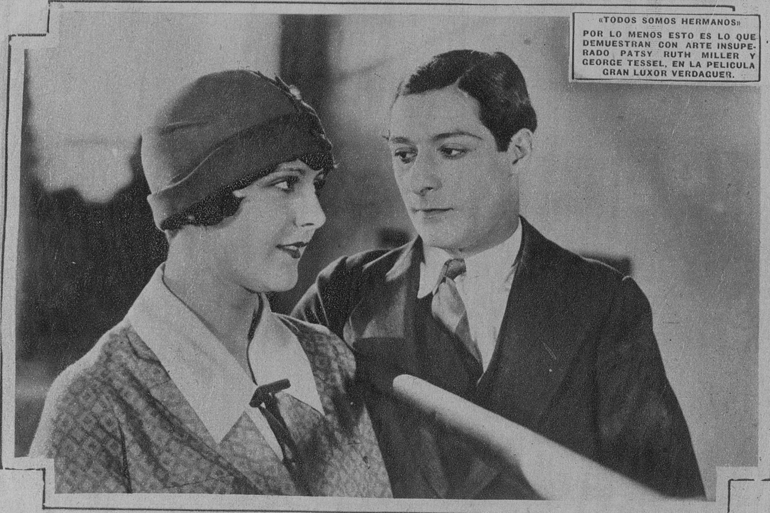
«TODOS SOMOS HERMANOS» POR LO MENOS ESTO ES LO QUE DEMUESTRAN CON ARTE INSUPE- RADO PATSY RUTH MILLER Y GEORGE TESSEL, EN LA PELICULA GRAN LUXOR VERDAGUER.