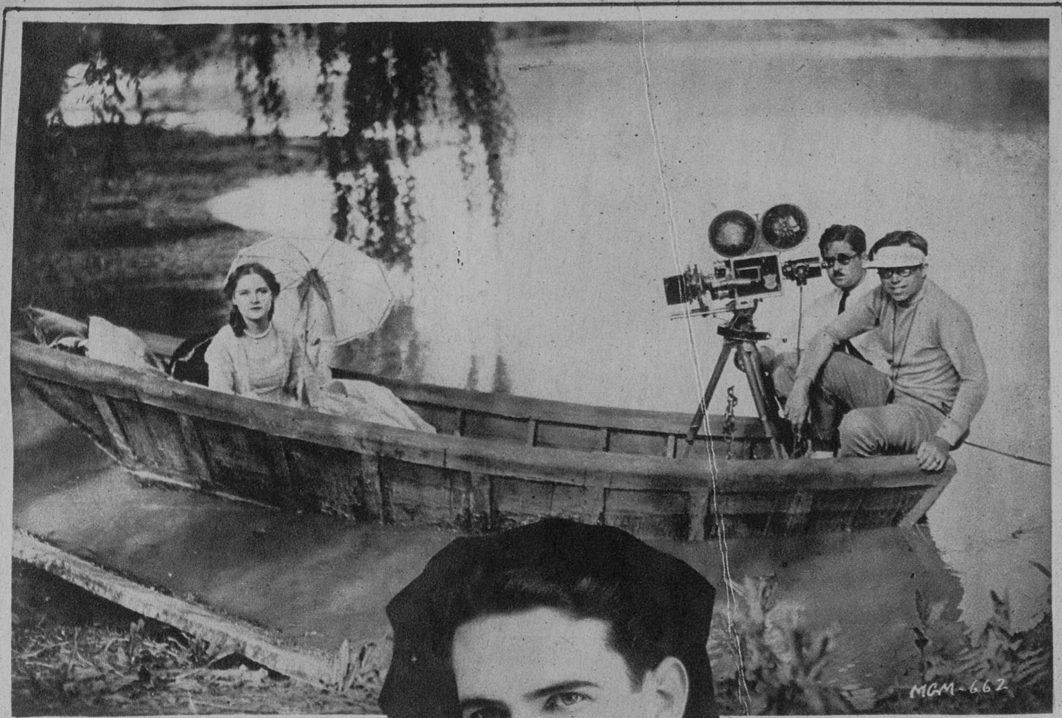
UNA ESCENA FLUVIAL ELEANOR BOARDMAN EN UNA PUNTA DE LA CANOA, BAJO LA SOMBRILLA, Y EN LA OTRA PUNTA EL OPERADOR Y KING VIDOR, DIRECTOR DE LA PELICULA.