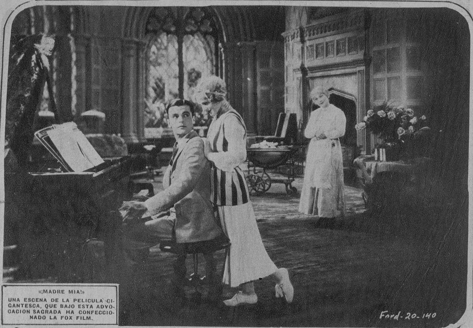
«MADRE MIA!» UNA ESCENA DE LA PELICULA GI- GANTESCA, QUE BAJO ESTA ADVO- GACION SACRADA HA CONFECIO- NADO LA FOX FILM.