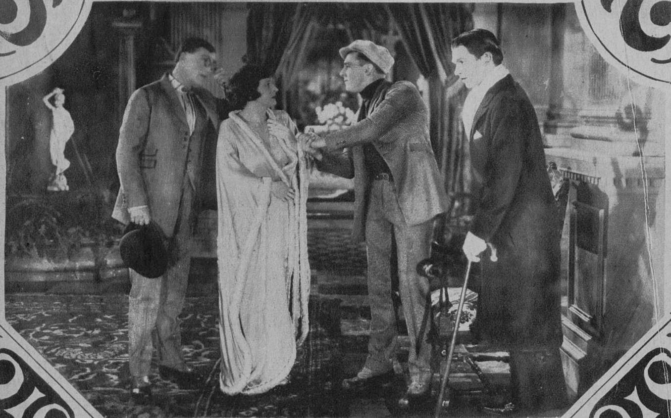
GENTE DE QUANTE

Estos dos artistas, que ningún público desconoce, crean los protagonistas de «El caballero del Amor», película de la M. C. M.