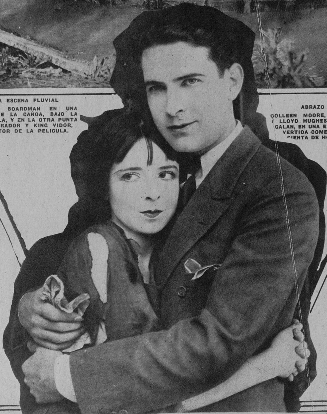
ABRAZO FINAL COLLEEN MOORE, LA PIZPIRETA, Y LLOYD HUGHES, EL PERFECTO GALAN, EN UNA ESCENA DE LA DI- VERTIDA COMEDIA «LA DENI- CIACION DE HOLLYWOOD».