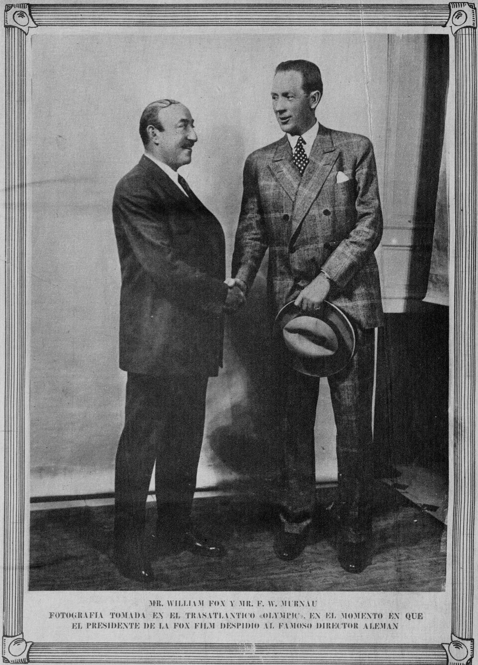
MR. WILLIAM FOX Y MR. F. W. MURNAU FOTOGRAFIA TOMADA EN EL TRASATLANTICO «OLYMPIC», EN EL MOMENTO EN QUE EL PRESIDENTE DE LA FOX FILM DESPIDIO AL FAMOSO DIRECTOR ALEMAN