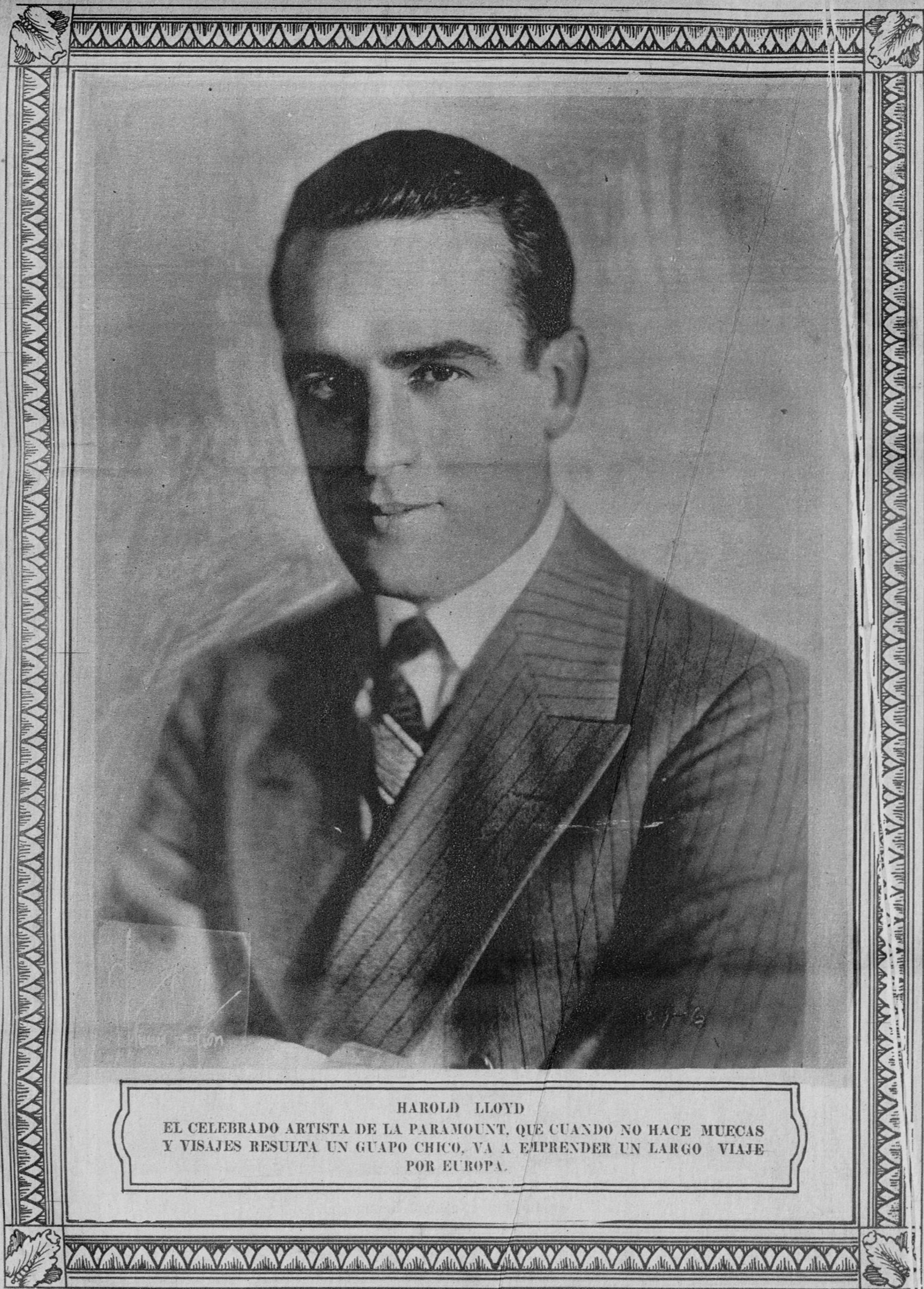
HAROLD LLOYD EL CELEBRADO ARTISTA DE LA PARAMOUNT, QUE CUANDO NO HACE MUECAS Y VISAJES RESULTA UN GUAPO CHICO, VA A EMPRENDER UN LARGO VIAJE POR EUROPA.