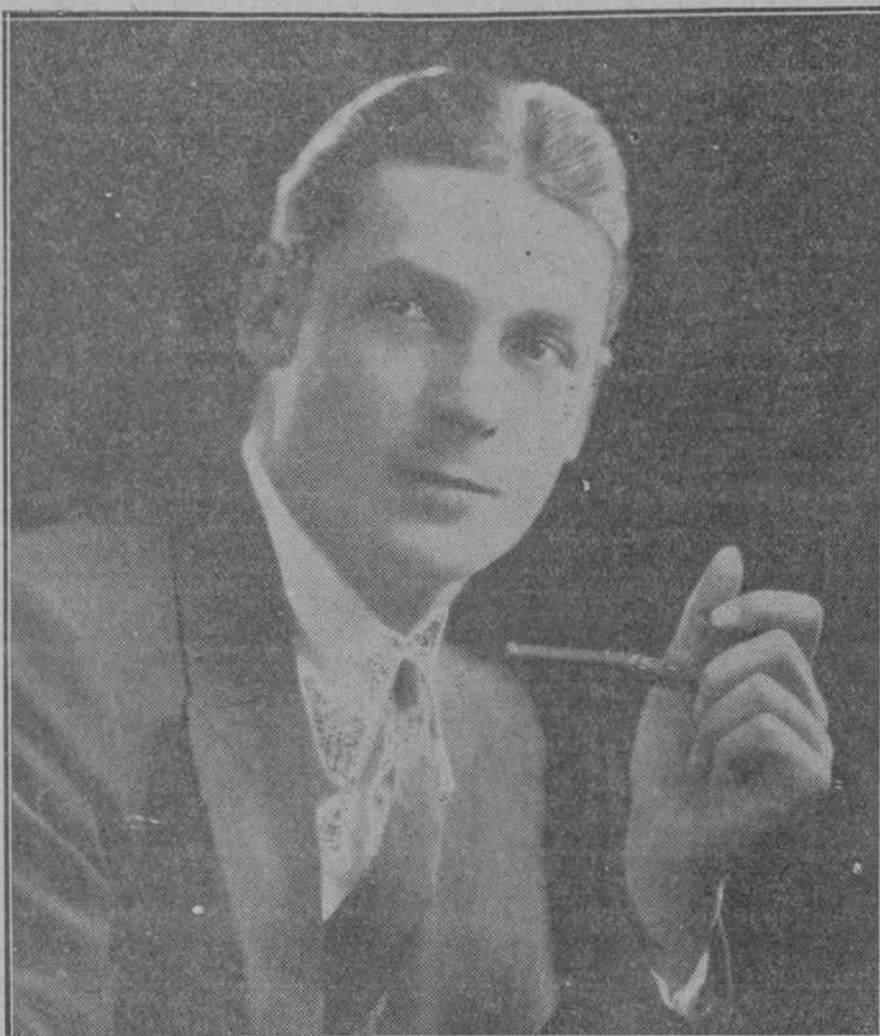
Charles Farrell, cuyo triunfo en "El séptimo cielo" le ha colocado entre los "astros" del arte mudo.

Las mejores películas de producción nacional son exclusivas de la CINEMATOGRAFICA ESPAÑOLA y pertenecen al PROGRAMA MARQUEZ "Por fin se casa ZAMORA", por el glorioso guardameta internacional Las más grandiosas cintas de la genial OSSI OSWALDA Entre las que se destacan "Colibri" y "Todos acaban casándose" La creación de la más hermosa estrella ITALIA ALMIRANTE "LA VUELTA A LA VIDA" y la preciosa comedia de la monísima DOBBY DAVIS "ALIANZA PELIGROSA" pertenecen a la GASA MARQUEZ AYALA, 50, MADRID, y PANADEROS, 8, MALAGA.