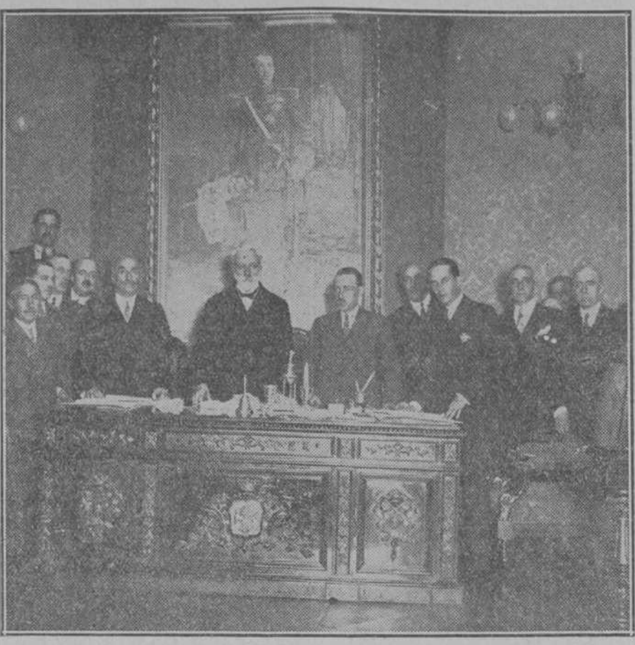
ANTE LA ASAMBLEA NACIONAL.—Votación celebrada ayer mañana en la Diputación Provincial madrileña para designar el representante que irá a la Asamblea Nacional Consultiva por esta Corporación.

DOMINGO. Desastre taurino en la Plaza de Madrid, a cargo de tres seudofuertes: Márquez, Rayito y Cagancho.