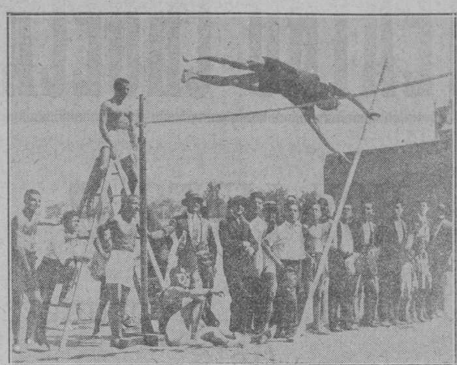
ATLETISMO EN MADRID.—Un notable salto con pértiga en el concurso celebrado ayer en el campo de la Gimnástica.