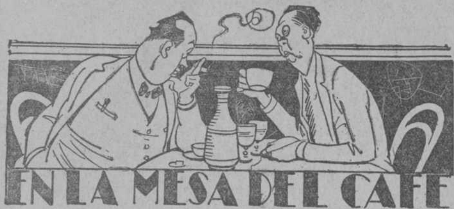
EN LA MESA DEL CAFE