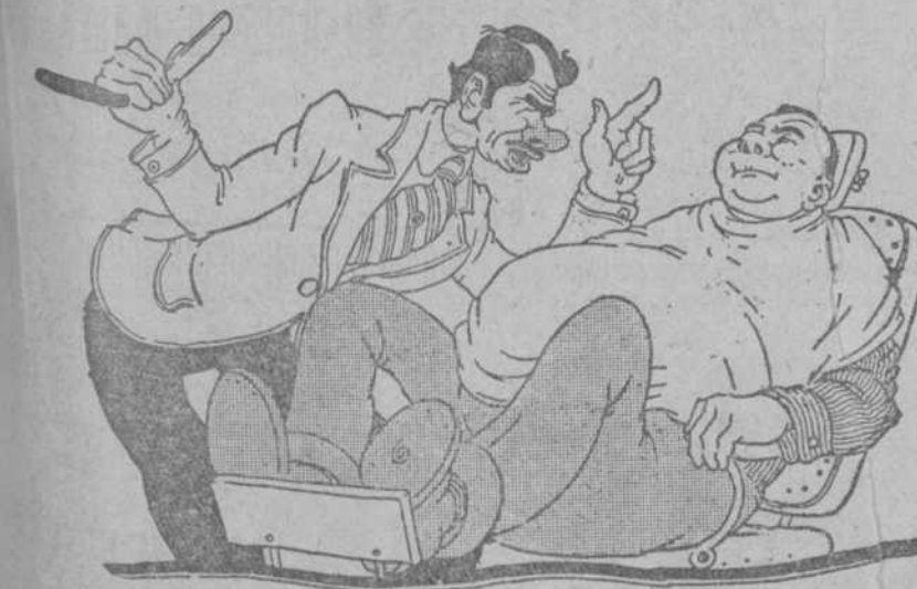
—Me lleva usted dados doce tajos. Me está mechando. ¿Ha sido usted verdugo? —Fui torero de postín en mi juventud, nada más.

Estuvo concurrísimamente, trasladándose desde Santander a Torrelavega, para presenciarla, un enorme gentío en trenes especiales y en numerosos automóviles, a pesar del tiempo desapacible, y lluvioso a ratos.