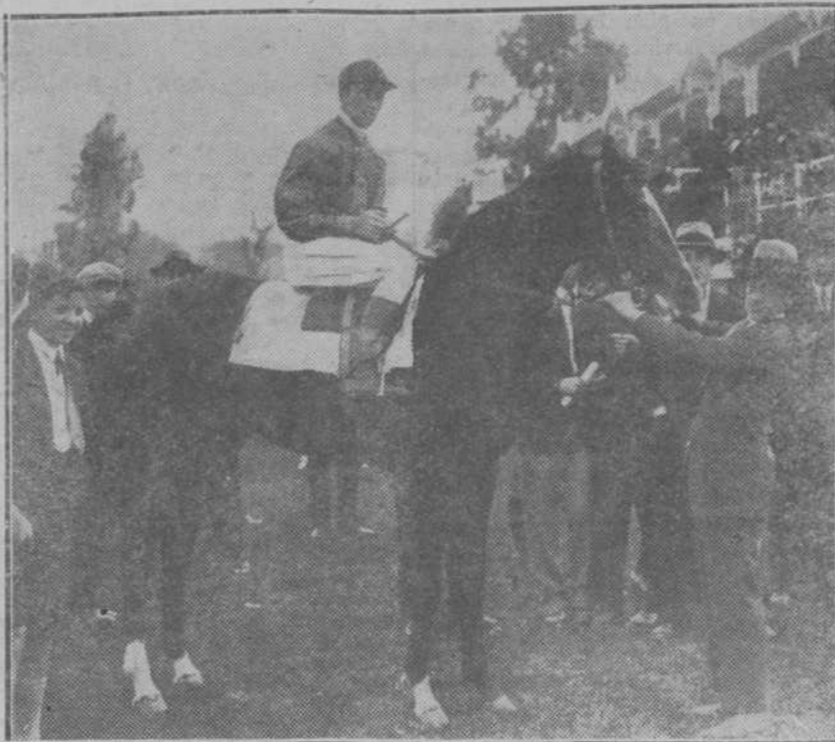
A. ER, EN EL HIPODROMO.—El caballo "Septimo", montado por Le-forsier, ganador del Premio Bilbao, de poco postas.

LORCA.—Sin que se haya podido averiguar la causa se hundió un horno de cal, resultando dos obreros muertos y tres heridos.