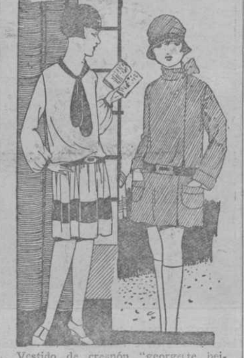
Vestido de crepón "georgette beige", adornado de terciopelo negro. Abrigo de lana rayada y cinturón de gamo.

La hechura de los pequeños es casi una prolongación. Renúnciese el detalle. La sencillez es el adorno infantil que más seduce la guarnición rústica; todo lo que denota simplicidad y alegría es para ellos.