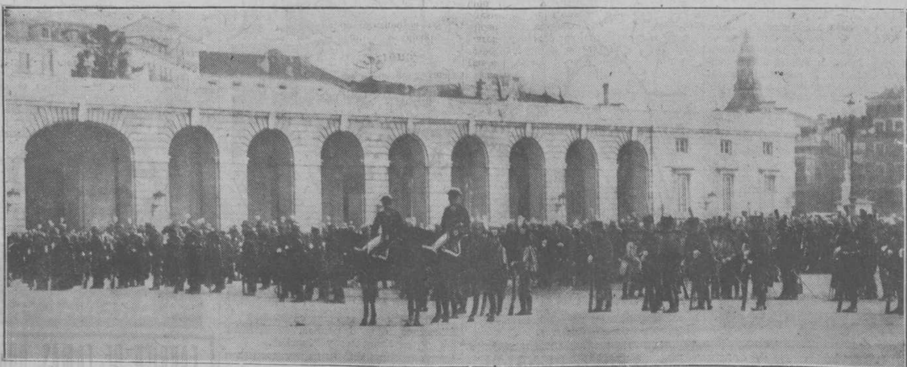
Aspecto que ofrecía la plaza de la Armería durante la recepción militar de ayer con motivo del santo de Su Majestad el Rey.

ORENSE.—Por la festividad del santo de Su Majestad el Rey se celebró solemne recepción, desfilando todos los elementos oficiales, entidades y particulares, y representaciones de Unión Patriótica y Somatenes, testimoniando así su adhesión al