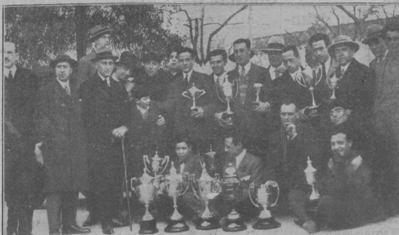
EN LA CUESTA DE LAS PERDICES.—Corredores que fueron premiados en las diversas carreras corridas durante el año 1926, retratados al finalizar el banquete con que el Real Automóvil Club les obsequió ayer en su "chalet".

Las audiencias del Presidente del Consejo de ministros. El Presidente del Consejo de ministros nos encarga hagamos saber que obligado los días que restan de enero y aun la primera semana de febrero a dedicarse al estudio y resolución de proyectos y expedientes notoriamente retrasados en su despacho, ruega a todos cuantos se propusieran visitarle lo aplacen hasta después del lunes 7, sin perjuicio de que sean llamadas las personas que deben informar en los aludidos asuntos pendientes, pero evitando la presentación de otros nuevos, que sin beneficio de ellos retrasarían el despacho de los que están en tramitación. En todo caso, para nada ni para nadie podría hacer excepción, de nueve a una de la mañana ni de seis a nueve de la noche, durante estos quince días que juzga indispensable para poner al corriente su despacho. CEMENTO VALDERRIVAS. Fábrica en Vicalvaro. Depósito: Estación del Niño Jesús. Fraguado lento. Endurecimiento rápido. ALTAS RESISTENCIAS. Portland VALDERRIVAS. Oléaga, 2. Teléfono 52.724. MADRID. Una gran nevada en León. LEÓN.—Reina un frío intensísimo. Hoy cayó una enorme nevada en esta ciudad. También ha nevado copiosamente en toda la provincia.