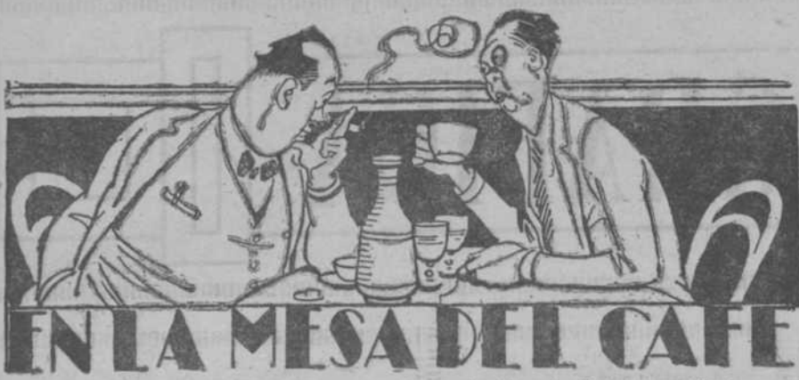
UNA MESA DEL CAFE