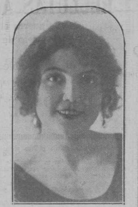
Conchita Supervia, la gran cantante española, magnífica contralto, cuyo arte ha encantado al público madrileño de la ópera.