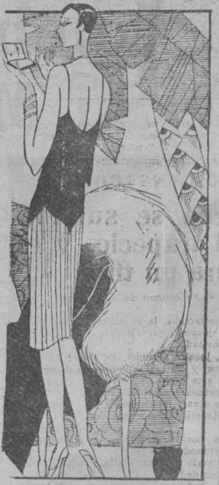
lenta del tallé, que no os pilla de sorpresa la falda se alargará un poco, pero no asustaros, pues será un poco. No habrá cambios bruscos. Las formas seguirán rectas, abultadas, los boleros algo más cortos; los pisados, tablas, "godels". Se verán largas túnicas de telas metálicas, colores preciosos rivalizando con los de nuestras abuelas, pequeños volantes pliegados o tres volantes anchos compondrán una falda. Se llevarán mucho los canesús. Casi todos los cuerpos tienen la disposición de chaleco

De esto debe derivarse la lección de que hay que ser extremadamente cuidadoso en el uso de los alimentos en conserva, y nunca hacer uso de ninguno que presente particularidades en materia de olor, apariencia, o gusto; y sobre todo, someter a una estricta cocción todo alimento en conserva. Sólo así puede haber seguridad de no ser víctima del terrible veneno.