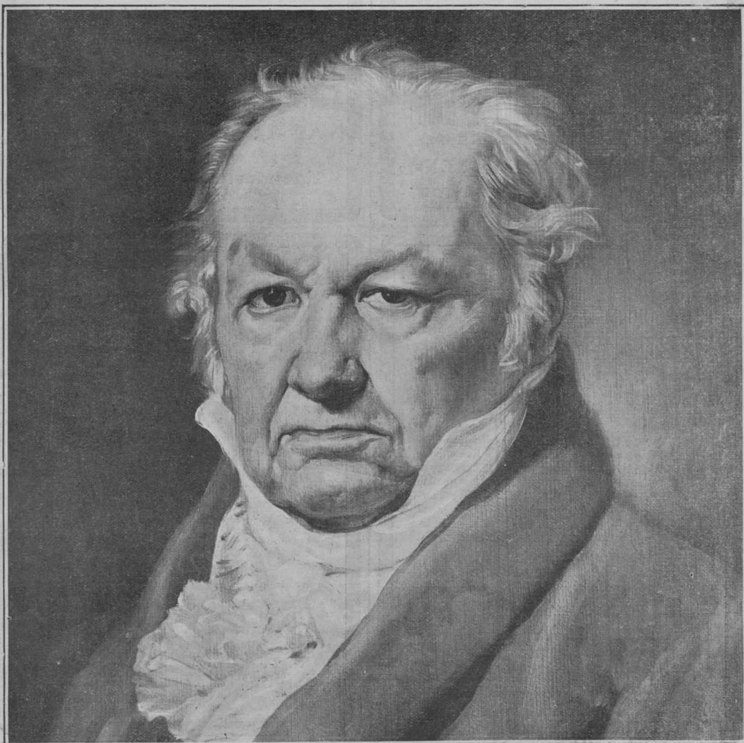
RETRATO DEL INMORTAL GOYA