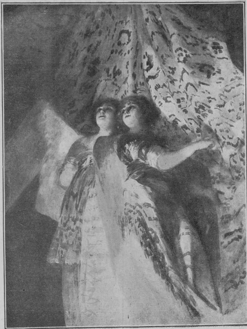
Grupo de ángeles.—Maravilloso fresco de Goya que se conserva en la Iglesia de San Antonio de la Florida.

Escribe: "Me había yo establecido un modo de vida envidiable: yo no hacía antesala ninguna: el que quería algo mío, me buscaba: yo me hacía desear más, y si no era personaje muy elevado o con empeño de algún amigo, no trabajaba nada para nadie: y por lo mismo que yo me había hecho tan preciso, no me dejaban (ni aun me dejan), que no sé cómo he