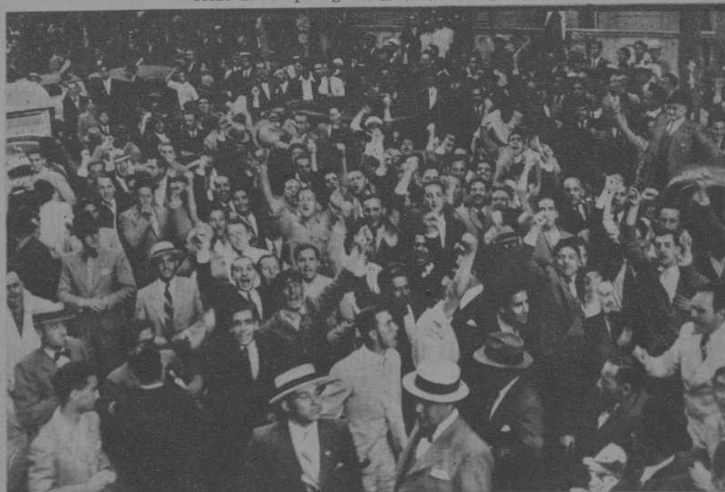
Y la multitud acogió la huida con demostraciones de alegría, manifestando a favor de la República española, frente a la Casa de España