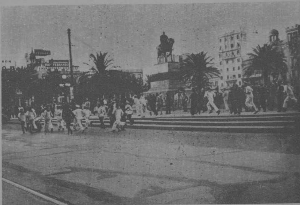
En la Plaza de la Independencia, en torno a la estatua del general Artigas, se registraron colisiones entre los marinos fascistas y el pueblo y aunque la policía procuró librar a los provocadores de las iras de la multitud, los marinos echaron a correr como si les persiguieran soldados españoles