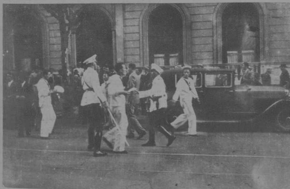
Pero a la provocación replicó el pueblo y la policía tuvo que proteger y sablear a alguno de los "bravos" fascistas italianos, como puede verse en estas dos fotografías