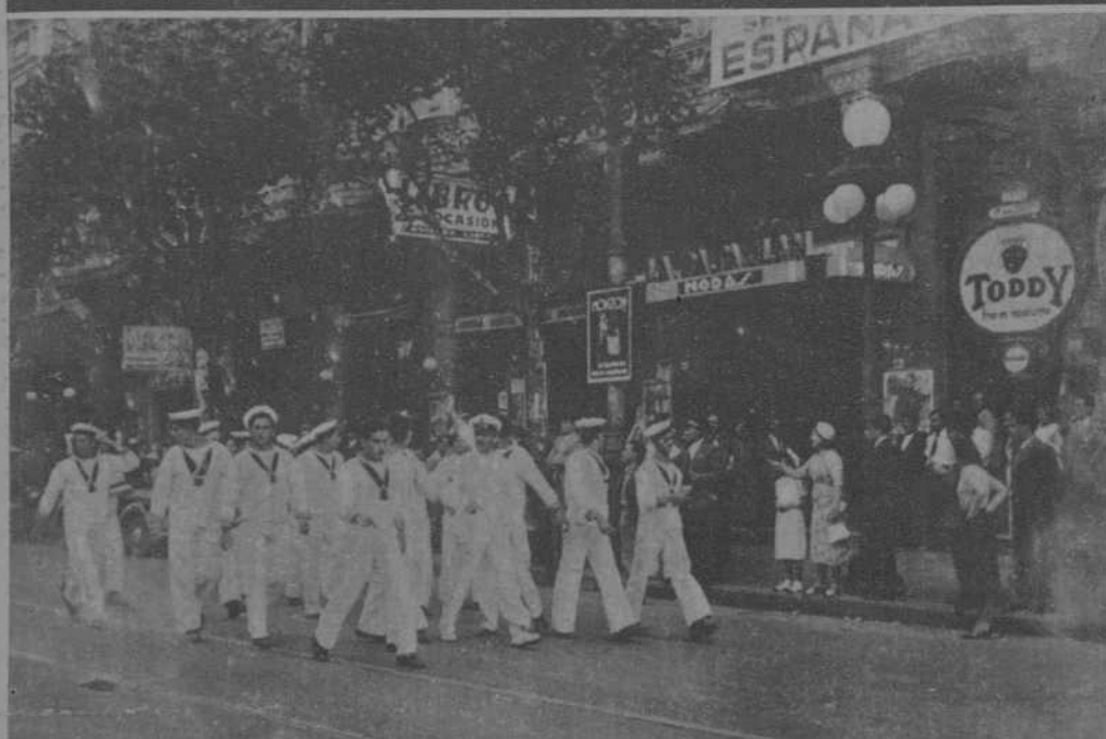
Helos aquí, provocativos, al pasar frente a la Casa de España, sede de los Comités de Ayuda al Gobierno de la República española

A la majeza de los oficiales y marinos de un buque de guerra italiano, el pueblo de Montevideo replicó con una repulsa violenta que determinó la huida de los "bravos" fascistas como en la Alcarria