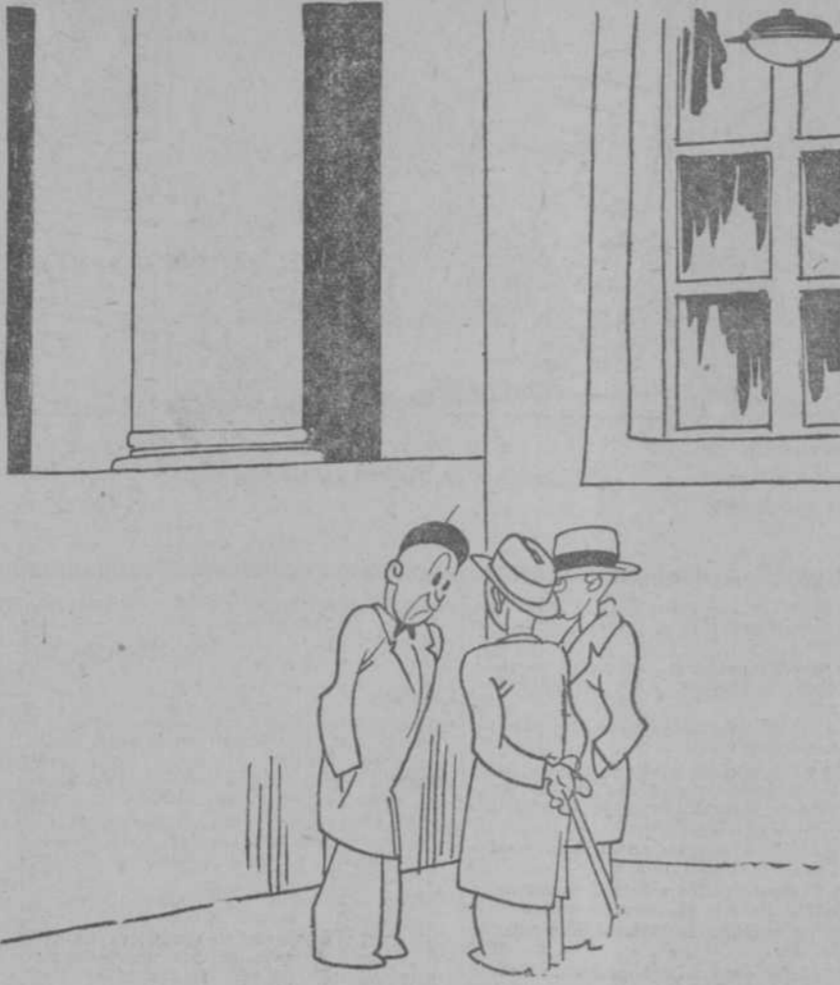
LOS SOCIALISTAS.—¿Qué hacer? ¿Entramos hoy? ¿Mañana? —Daremos otra vuelta a la manzana.