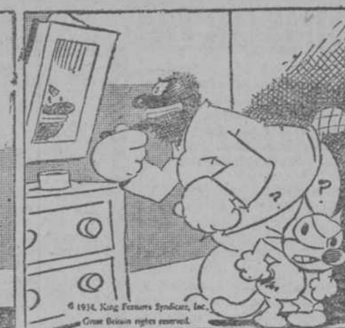
—Vámos a oír la "radio", verás.