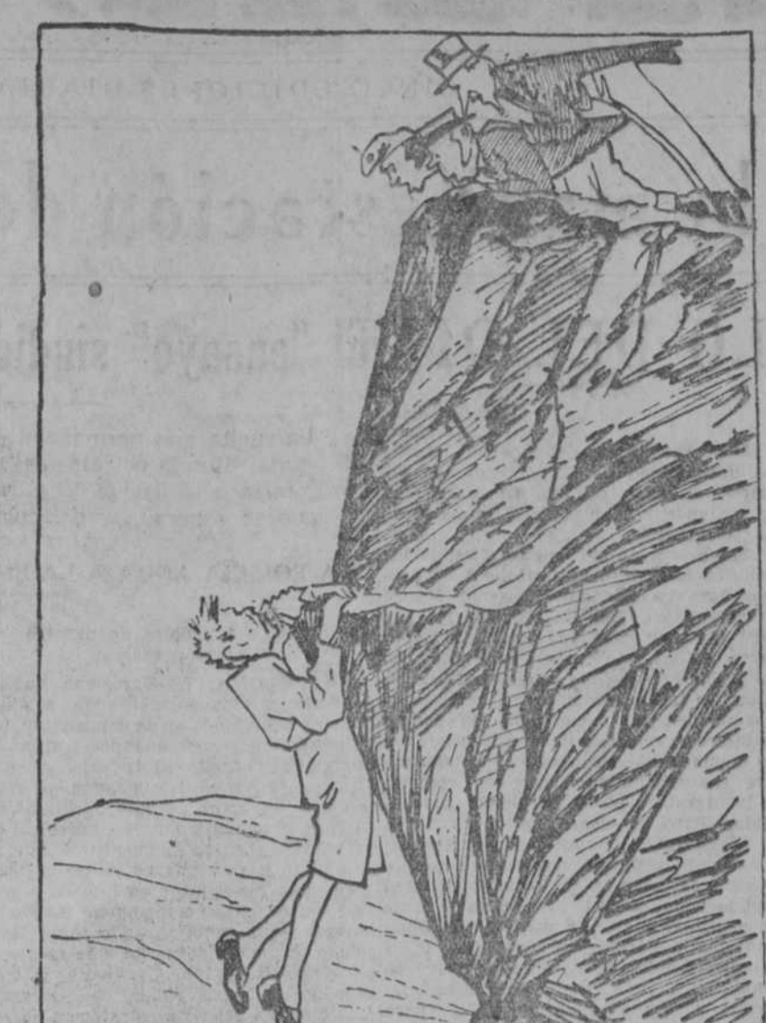
FRANCIA, INGLATERRA Y LOS ESTADOS UNIDOS (a Alemania).—An día subiendo y cuando estás arriba te caelamos una mano.

fralécido Justo Artega, a consecuencia de los disparos recibidos en una de las reacciones de las últimas horas.