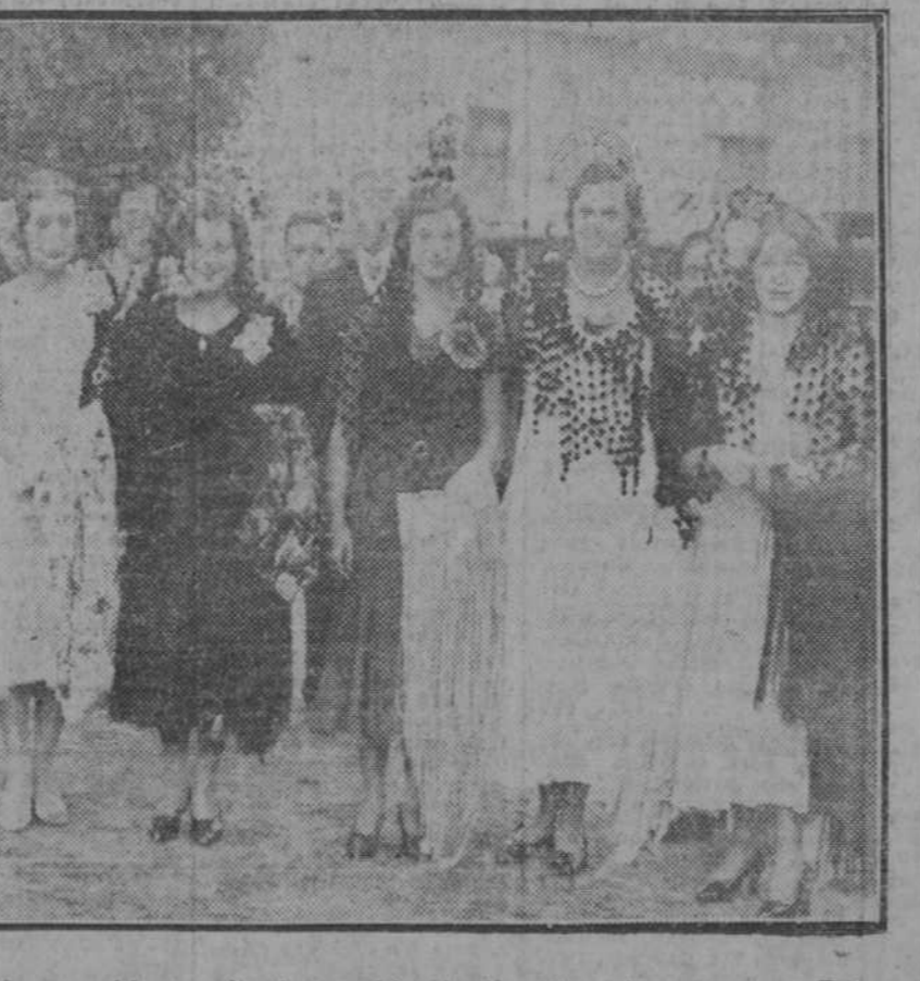
SAN SEBASTIAN. Las presidentas de la corrida de beneficencia

Precisamente estos "rayos de cobchán", esta haza de trapaculo, este orín místico y estas rosas moribundas que desde Chateaubriand acá, la poesía ha vertido sobre el paisaje, le dan un encanto mayor que aquellos que toca la aurora con sus dedos de rosa, mojada de rocío. La motivación de este poema parece haber sido la misma que siglos atrás había inspirado a nuestro poeta don fray Antón de Guebara su libro "Memorias de Cortes y alabanza de aldea". Está en la tradición y en la misma proyección visual que Bernardino de Saint Pierre y que Rousseau. Esta suerte de hombres, siempre retornan del campo contentos y felices y con un flor en la boca. El hombre del campo se afana en el trabajo en derredor suyo la felicidad, que es tanto más dulce cuanto más es compartida. Le bonheur le plus doux est celui que partage. Heureux ou malheureux l'homme a besoin d'autrui. Il ne vit qu'a moitié s'il ne vit que pour.