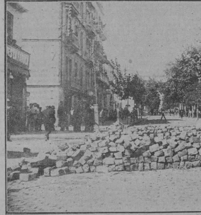
BARCELONA. Barricada que levantaron los huelguistas en la carretera de Coll Blanch.