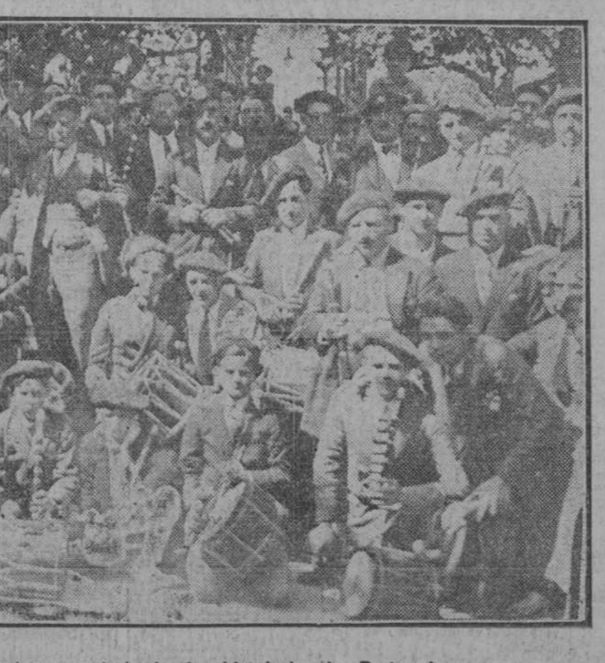
BILBAO. Un grupo de asistentes al alarde de chistularis de Portugaleta

"En el pueblo de Almadén de la Plata unos 300 individuos, armados de escopetas y palos, penetraron en el coto de caza El Berrocal y se dedicaron a la caza, apoderándose de seis ciervos que se repartieron equitativamente."