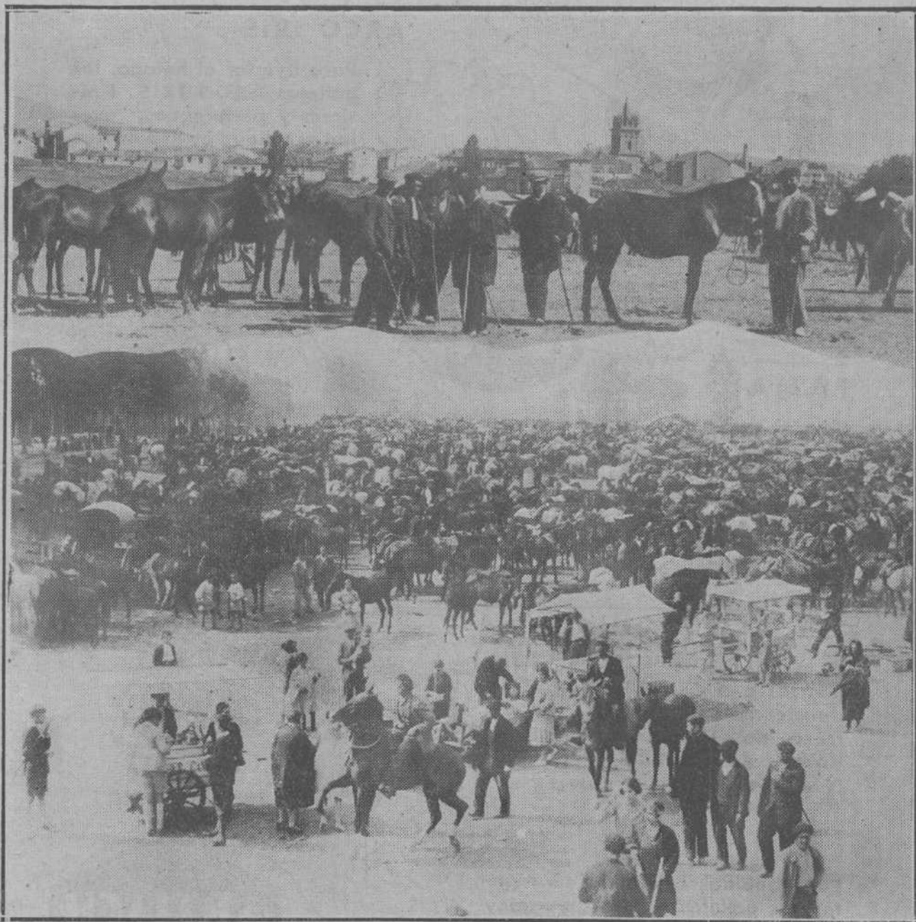
LA FERIA DE SAN MATEO EN REINOSA.—Con grandísima animación se están celebrando en la ciudad campurriana las renombradas feria y fiestas de San Mateo, de las que ha recogido el repórter gráfico las dos interesantes notas del grabado.

Pero el complot ha fracasado y la legión liberal se ve diezmada por el presidio, el destierro y las multas extralegales. Parece que todo ha concluído, y no es así. No se ha hecho más que empezar. La "media docena de vejesterios" son testarudos y tenaces. Se han propuesto devolver la libertad a su patria y no escatiman esfuerzo alguno para lograrlo. Don Miguel Villanueva sigue urdiendo complots y extendiendo la propaganda. Ya la conciencia liberal del país se va afirmando. Ya las juventudes escolares hacen frente en las calles a la fuerza pública, vitoreando a la libertad. Ya en el Ejército ruge el descontento, como un tigre enjaulado. Se organiza el desembarco de Sánchez Guerra en Valencia, que fracasa también. Pero don Miguel Villanueva no se abate. Las dos derrotas le sirven de experiencia para que el tercer intento sea un triunfo. Y se organiza el levantamiento de Andalucía, que dirigen Burgos Mazo y el general Goded. Cuando iba a estallar se