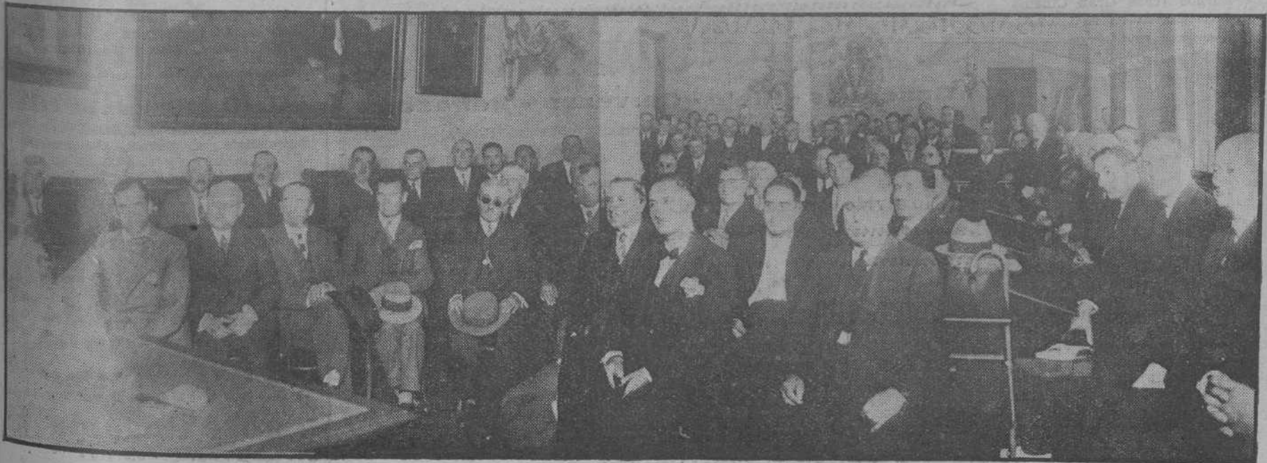
LA ASAMBLEA DE ALCALDES.—Ayer se celebró en la Diputación este importante acto, en que se tomaron importantísimos acuerdos. La «foto» representa un aspecto de la sala durante la Asamblea.

En números próximos ampliaremos detalles de esta magnífica feria-exposición.