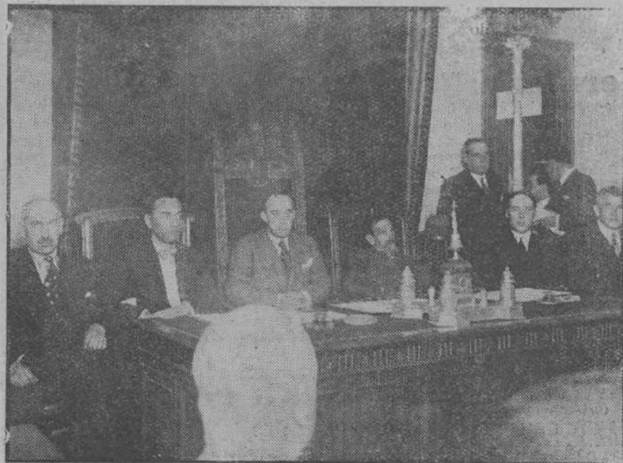
AYER, EN LA DIPUTACION.—La mesa que presidió la importante Asamblea de alcaldes de toda la provincia.