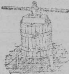
Presas para uva y manzana desde 70 Ptas Estrujadoras para uva y manzana desde 100 Ptas Machacadoras para manzana desde 100 Ptas Fabricadas en MATEL SHIPP BILBAO. Almacén de Maquinaria 70 y 80

situada, precio económico. Informarán, calle Doctor Madrazo, 18, entresuelo.