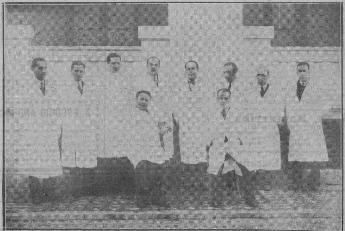
Los doctores que componen el cuadro facultativo del Jardín de la Infancia, reunidos con motivo de unos interesantes estudios profesionales realizados en la Casa de Maternidad