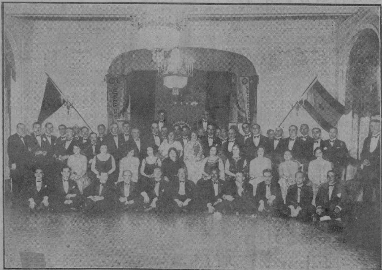
LA ASAMBLEA DE LOS ROTARIOS EN SANTANDER.—Con motivo de celebrarse en Santander la Asamblea de los rotarios españoles, los asambleístas se reunieron en fraternal banquete en el Hotel Real.