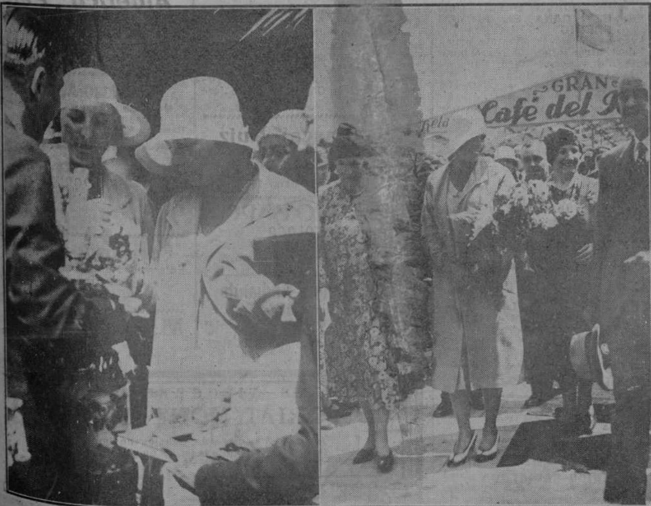
TOMBOLA BENEFICA.—Ayer inauguraron Sus Altezas las infantas doña Beatriz y doña Cristina, con gran brillantez, la tómbola benéfica de la Cruz Roja, que se ha visto animadísima.

ROGAMOS A CUANTOS TENGAN QUE DIRIGIRSE A ESTE PERIODICO, QUE MENCIONEN NUESTRO APARTADO DE CORREOS NUMERO 62. EL NO HACERLO PUEDE OCASIONAR ALGUN RETRASO LA RECEPCION DE LA CORRESPONDENCIA