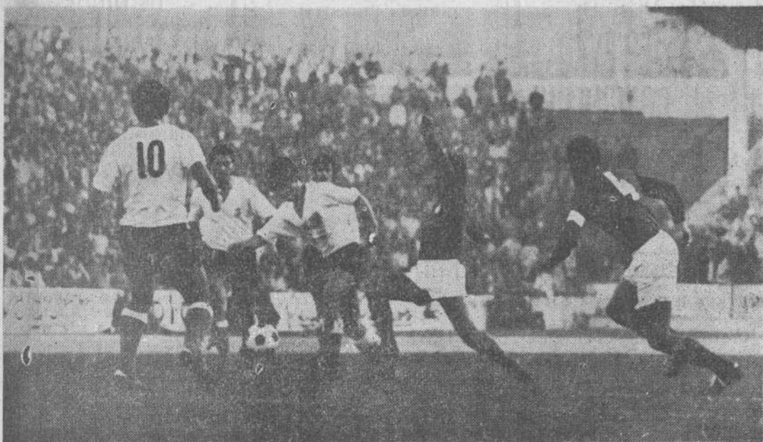
Una jugada de peligro en el área de la Leonesa, en el primer tiempo del partido.

Leonesa no dejaba de crear peligro y de que, consiguientemente, el 1-0 no era resultado suficiente, que hacía falta, como el comer, un segundo gol.