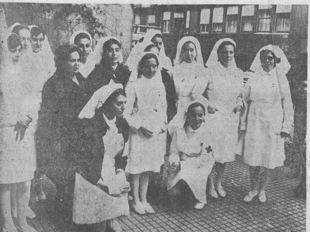
Grupo de damas enfermeras, a las que fueron entregados los carnets y brazaletes en la fiesta de la Cruz Roja.

Ayer tuvo lugar la fiesta patronal de la Cruz Roja Española. Ya durante las primeras horas de la mañana se dejaron oír las notas de dinas floreadas por nuestra ciudad, a cargo de la banda de cornetas y tambores de la institución. A las doce de la mañana se celebró una misa, en la Iglesia de los PP. Capuchinos, con asistencia de las primeras autoridades civiles y militares y todas las secciones que componen la Cruz Roja Española en Santander. Antes de la misa revisó las tropas el general gobernador militar, y después de ella se celebró una parada militar a cargo de los componentes de la Brigada de Tropas de Socorro número 23, por la calle de Juan de la Cosa. A esta parada asistieron los señores con su nuevo uniforme, seguidos del equipo de montañeros alpinos y esquiadores, hombres-rana, equipo de salvamento acuático, con su correspondiente lancha de salvamento y todas las unidades motorizadas de que dispone la compañía de Santander. Fue muy vistoso el desfile y el recorrido del mismo fue muy aplaudido por el numeroso público que lo presenciaba. A continuación se celebró un acto, en el salón de la institución, en el que les fue impuesta el brazalete e insignia a las nuevas damas auxiliares de la Cruz Roja, y durante el mismo le fue impuesta la Medalla de Oro de