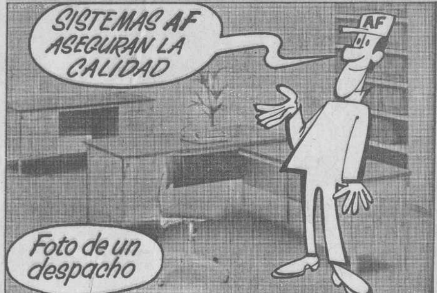
Foto de un despacho