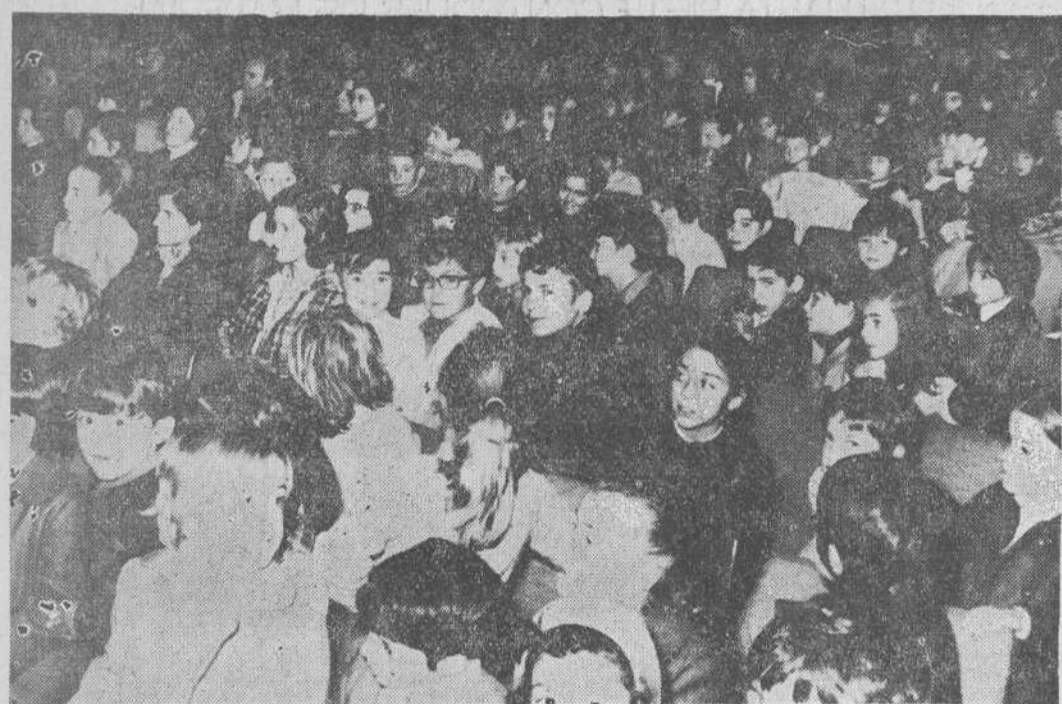
Numerosos niños que asistieron al Concurso de Villancicos celebrado en el cine de los Salesianos.