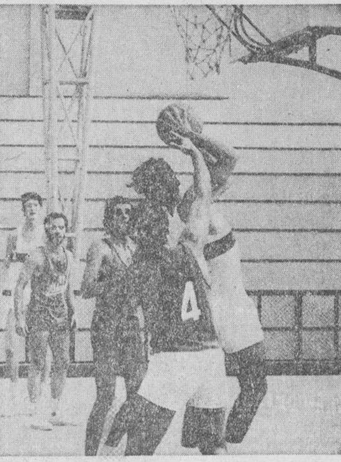
Ayer se inauguró la Liga en baloncesto, enfrentándose en el pabellón de los Escolapios el Alisas, de Santander, al Aldapeta, de Vizcaya. En la foto, momento en que los montañeses marcan uno de los tantos.