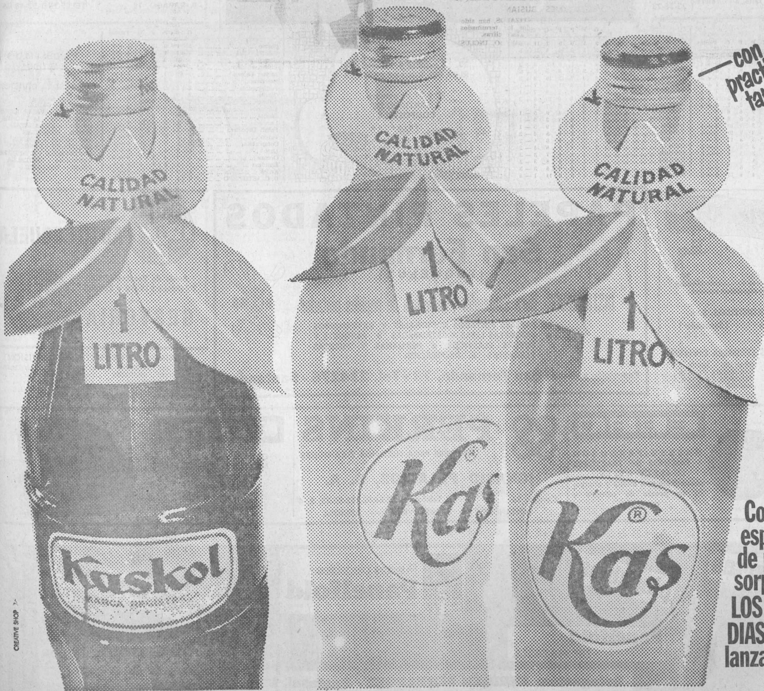
Kas Naranja, Kas Limón y Kaskol, son refrescos de zumos naturales. Ahora, también en botella de litro.