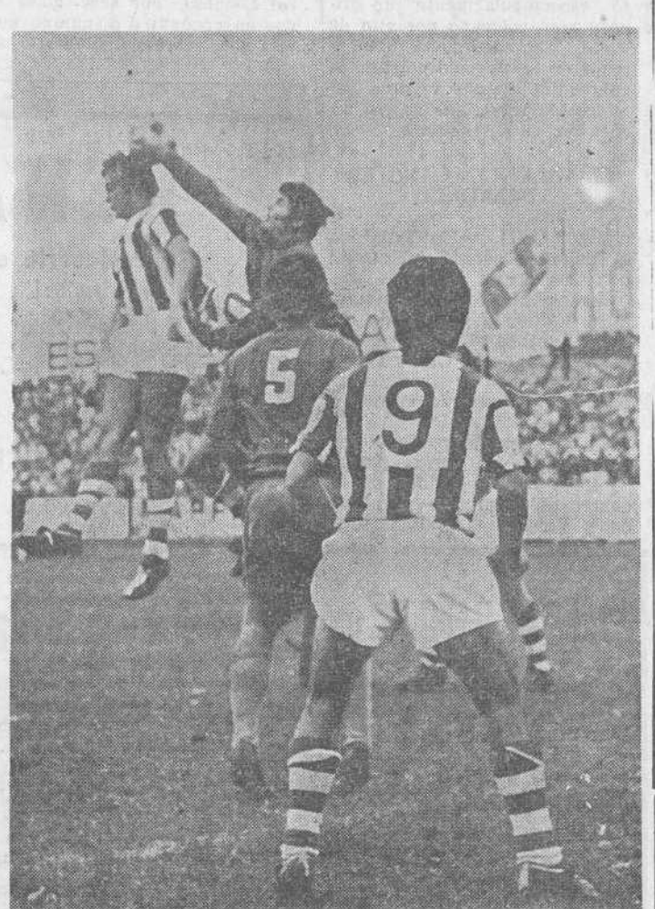
El portero del Compostela despeja de puño un balón que se disponía a rematar Goñi.

1-0-8 minutos del primer tiempo. Jugada por la izquierda de la Gimnástica. Llega el balón a Echevarría, quien dribla a un