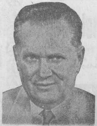
Tito asegura que está plenamente satisfecho con el resultado de las maniobras «Libertad 71», y añade que han de-

Belgrado. (Efe).—Un desfile de casi una hora, en el que han participado unidades seleccionadas de las fuerzas que han intervenido en los supuestos tácticos, ha cerrado oficialmente las maniobras «Libertad 71», las mayores realizadas en la historia de Yugoslavia después de la guerra. En un discurso de energía desconocida desde hace muchos años, el presidente yugoslavo y comandante supremo de las fuerzas armadas, mariscal Tito, ha subrayado que «Yugoslavia advierte de antemano a todo posible agresor que cualquier ataque contra el país chocará con la mayor resistencia imaginable del pueblo entero». «Nosotros (Yugoslavia) no reconocemos a nadie el derecho de imponer su voluntad por la fuerza a los demás, ni de interferir en los problemas internos de otros países».