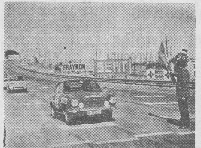
El premio "Renault TS" fue para la pareja Van Dulken-Anholín, con "Renault 8 TS". El trofeo "Seat" se lo adjudicaron Fustas - Tato, con "1430". El premio al primer "Seat Sport Coupé" fue para Asís-Riera, y el segundo, para Muñoz-Valero.