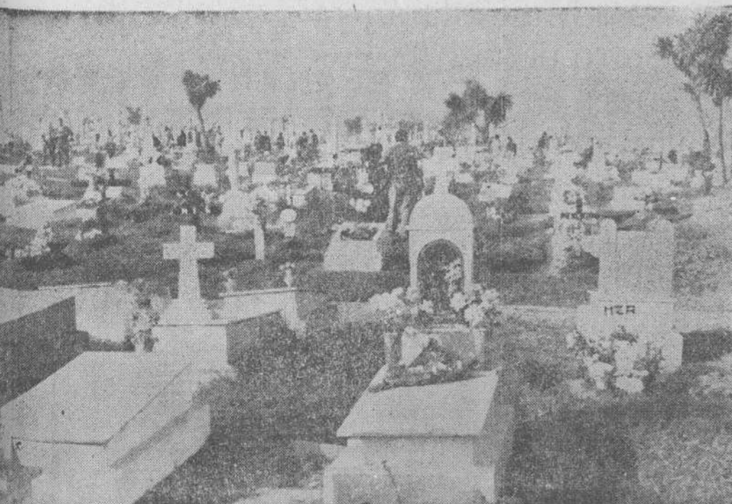
Culminaron ayer las jornadas de la visita a nuestros difuntos. Desde por la mañana, a primera hora, numerosas personas se trasladaron al cementerio de Ciriza para orar por nuestros muertos como han sepultado sus restos donde reposan y que estos días habían sido cubiertos de flores, como placido se recuerda.