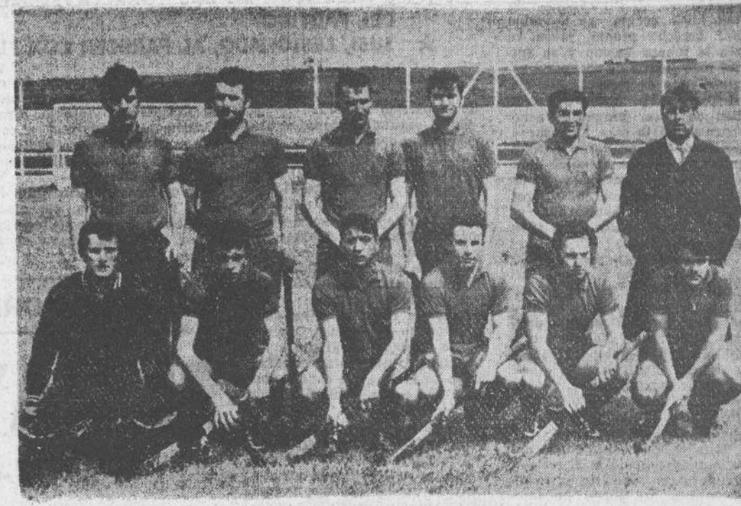
El Alcazar, de Santander, que se enfrentó a Jolaseeta, de San Sebastián, empatando a cero.

Madrid. (Afil).—En el escrutinio preliminar de las Apuestas Mutuas Benéficas han aparecido veinte boletos de catorce aciertos; setecientos ocho de trece, y nueve mil ciento veintitrés de doce. La recaudación ascendió a doscientos nueve millones de pesetas.