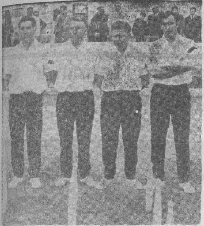
Equipo de la Peña Mallavia, de Torrelavega, que ayer venció por 5-1 a Solvay en el partido inaugural del Torneo Diputación.

Con algunas suspensiones por la lluvia Comenzó la temporada de Liga con los triunfos de Mallavia, Ebro y Zurdo de Bielva