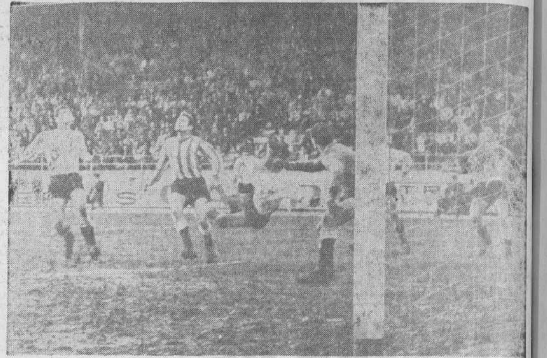
Una jugada de peligro ante la meta del Burgos (jersey blanco y pantalón negro) que un defensa despeja en posición espectacular. Mollán intentaba el remate.