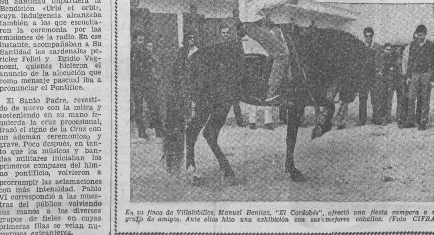
En su finca de Villalobillos, Manuel Benítez, «El Cordobés», ofreció una fiesta campera a un grupo de amigos. Ante ellos hizo una exhibición con sus mejores caballos.