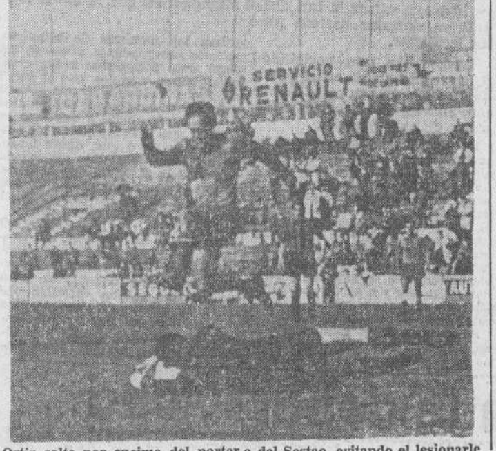
Ortiz salta por encima del porter del Sestao, evitando el lesionarse