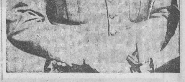
Como en el Congo

Kinshasa. (Efe-Reuters).—El Presidente Mobutu del Congo ha dicho que cuatro «gangsters» habían sido enviados con la misión de asesinarle. El Presidente hablaba en un desfile habido en Luluaburgo —provincia de Kasai Occidental— adonde llegó para pasar las fiestas de Pascua. El General Mobutu dijo que los gangsters habían sido enviados desde Kinshasa a Luluaburgo, pero no expresó claramente si el atentado se llevó a cabo. Mobutu, según ha informado la agencia congoleña de Prensa, dijo que «molestos por nuestros triunfos políticos, tres ex parlamentarios de esta provincia desearon que me asesinaran antes de las elecciones legislativas». No mencionó nombres. Las elecciones legislativas han de celebrarse este año en el Congo, pero aún no se ha señalado la fecha. Mobutu volverá a Kinshasa el martes.