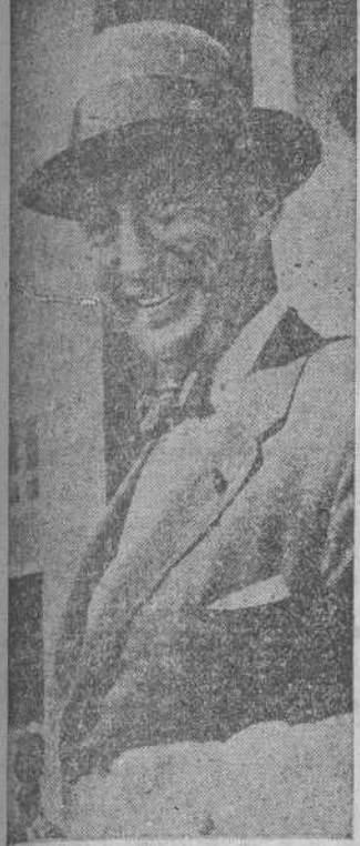
Nueva York. (Efe).—El embajador de los Estados Unidos en las Naciones Unidas, Adlai E. Stevenson, ha marchado hoy por vía aérea a Caracas, Venezuela, con objeto de iniciar su gira por diez países iberoamericanos.