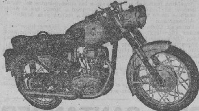
Mod. 175 - Turismo