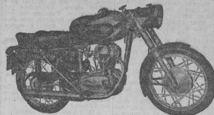
Mod. 200 c.c. - Elite

MOTO DUCATI PRIMERA MARCA MUNDIAL DE VENTA EN 53 PAISES DUKATI ECONOMICA - 4 TIEMPOS - 4 VELOCIDADES CONSUMO: 2 LITROS 100 KMS. GASOLINA SIN MEZCLA Concesionario «CRENEX» CARLOS FERNANDEZ AGUDO Garmendia, 4-6 DUKATI 125 c.c. Turismo 90 Km. hora 125 c.c. Sport 110 Km. hora 175 c.c. Turismo 110 Km. hora 200 c.c. Elite 140 Km. hora (Modelos)