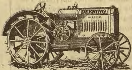
Tipos 10-20 y 15-30 (22-36 HP.)