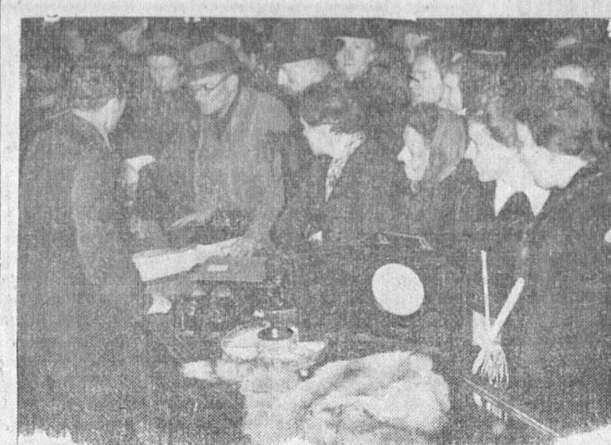
En Berlín ha sido montada una oficina destinada al intercambio de aquellos objetos que a causa de las actuales circunstancias no se encuentran fácilmente en el mercado