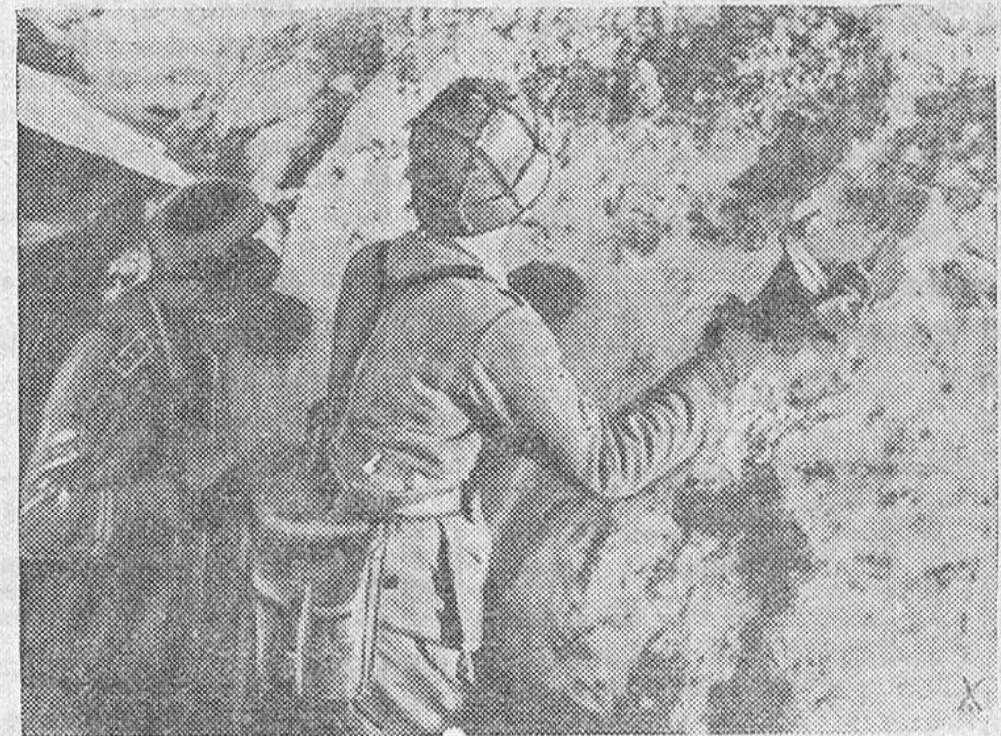
Granaderos alemanes esperan ocultos en una trinchera la proximidad de los tanques soviéticos para atacarlos con sus bombas de mano.