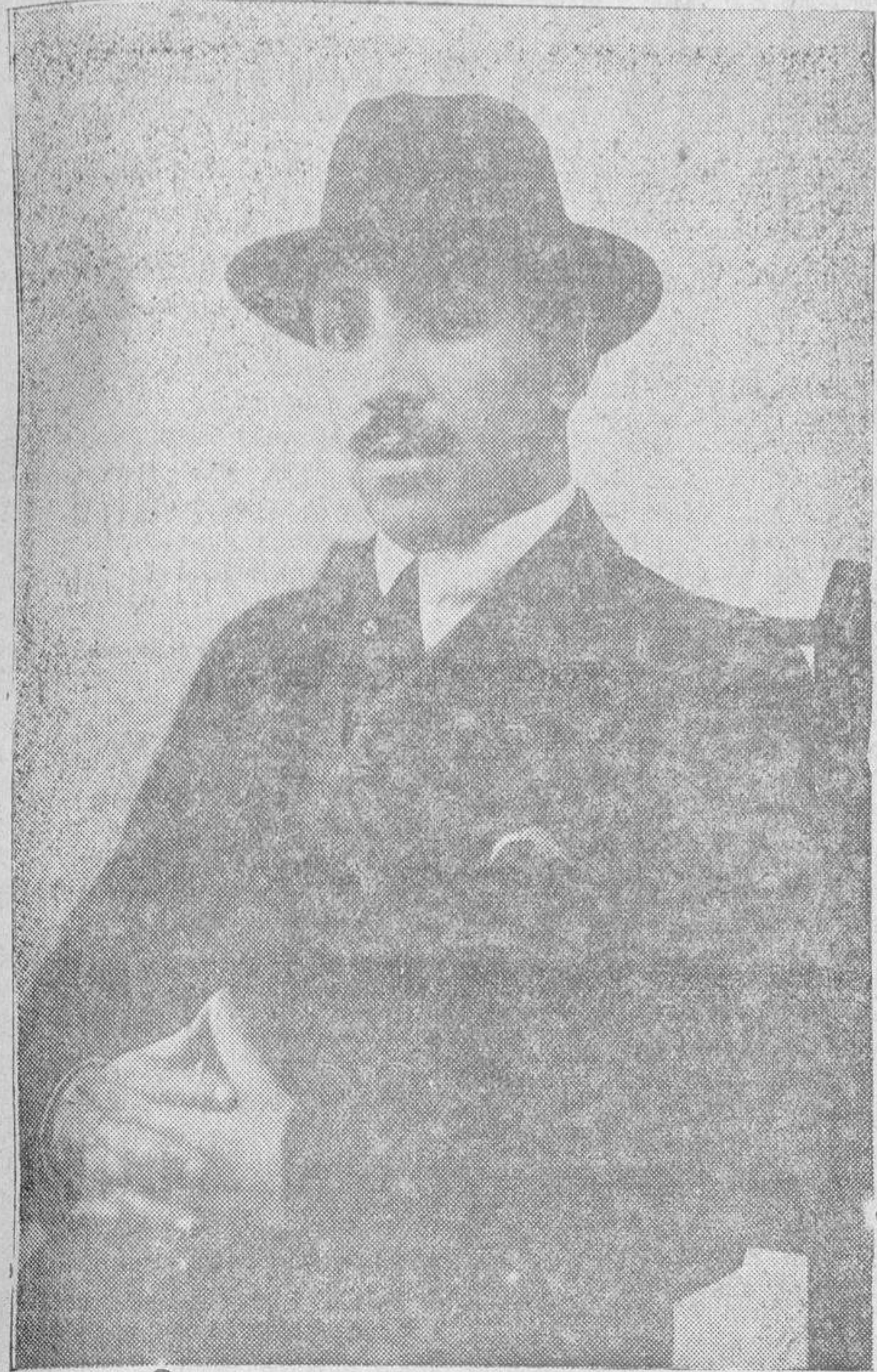
Don Luis de la Peña López, gobernador civil de Avila.