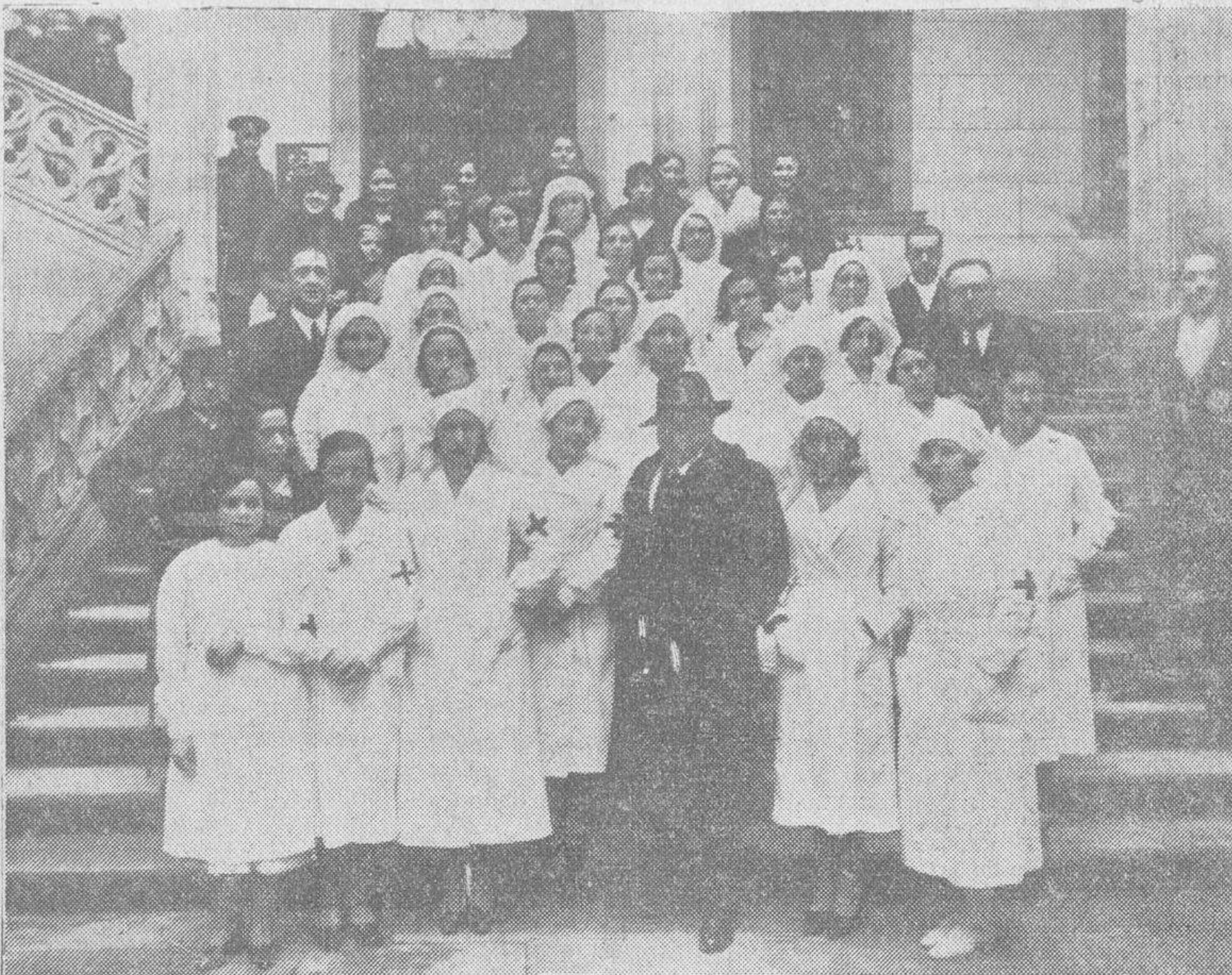
Las nuevas damas auxiliares de la Cruz Roja, con el general Burguete y otras autoridades en el patio del palacio de la Salina

Nos echamos la cuenta de que el fregar una mano de comiseración al caldo bajo el enorme peso de la desgracia, es algo sublime que descarga el sentimiento humano y no pasará desapercibido a nuestro claro entendimiento que estos diques de consuelo fueron levantados con el fin de recoger los escombros que quedaron bajo el enorme peso de la tribulación psíquica y corporal, claudicaron sin la suficiente fortaleza para oponerse a la ruda embestida de las pasiones desahuciadas con el ímpetu amenazador del moderno vivir, lo mismo en el