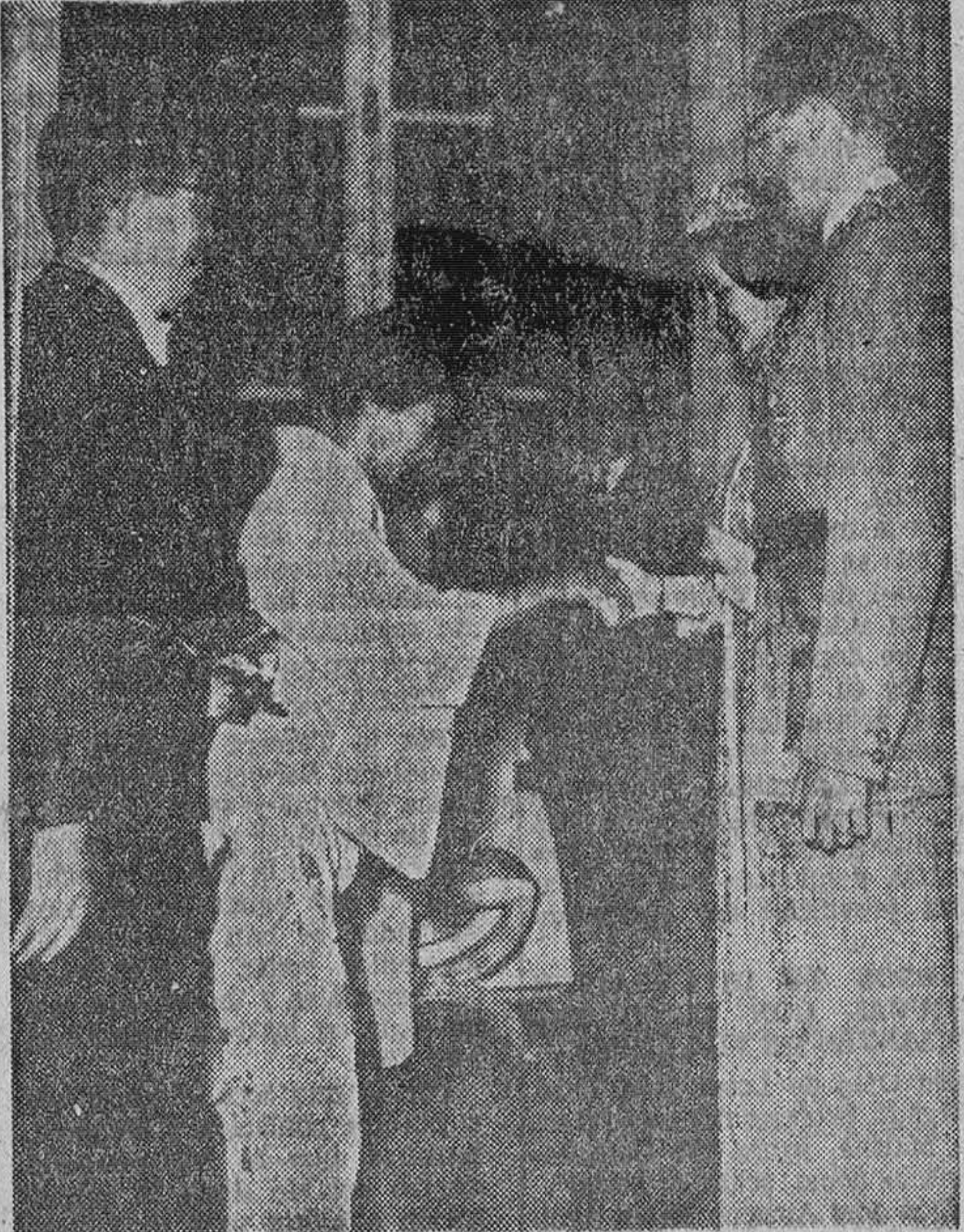
Los embajadores de Japón en Bélgica saludan ceremoniosamente a los Reyes Balduino y Fabiola durante la recepción del Nuevo Año adelantada este año con motivo del viaje a Extremo Oriente de los soberanos.

En su viaje hacia el Extremo Oriente los soberanos se detendrán en Tierra Santa