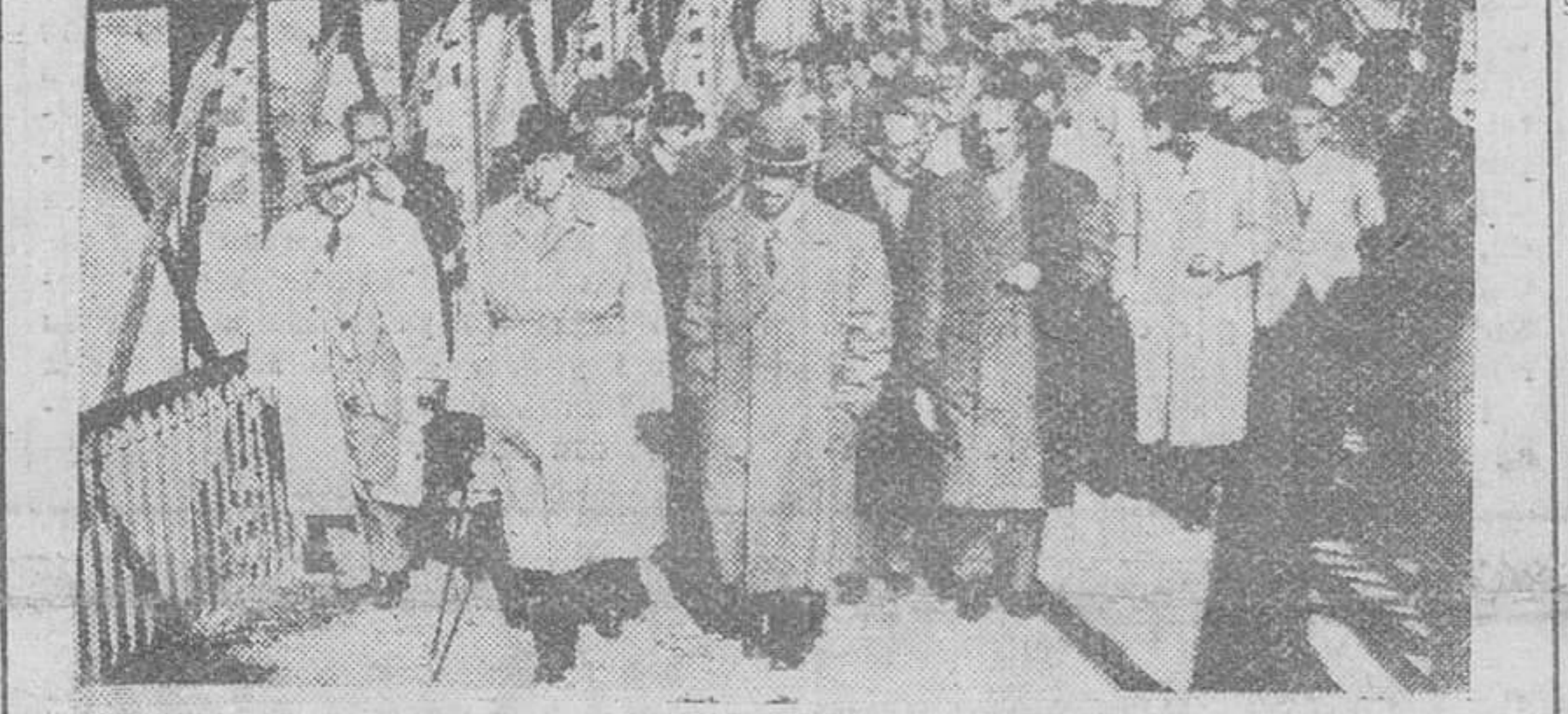
Madrid. — El conde de Valluelano acompañado del gobernador civil de la provincia y otras personalidades, a su paso por el puente que cruza el pantano de la Peña, con motivo de su visita al mismo.