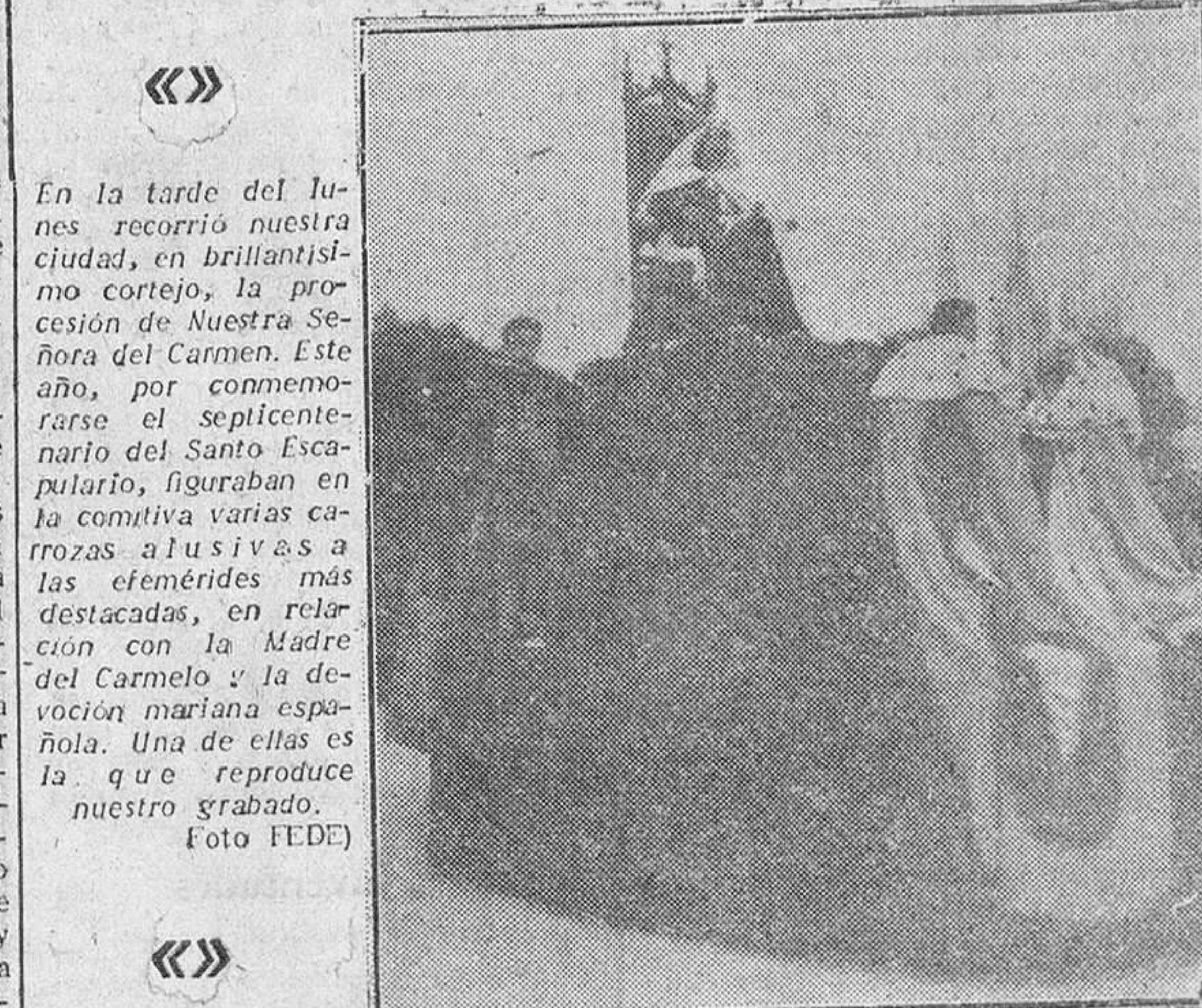
En la tarde del lunes recorrió nuestra ciudad, en brillantísimo cortejo, la procesion de Nuestra Señora del Carmen. Este año, por conmemorarse el septuagésimo aniversario del Santo Escapulario, figuraban en la comitiva varias carrozas alusivas a las vicisitudes más destacadas, en relacion con la Madre del Carmelo y la devoción mariana española. Una de ellas es la que reproduce nuestro grabado.