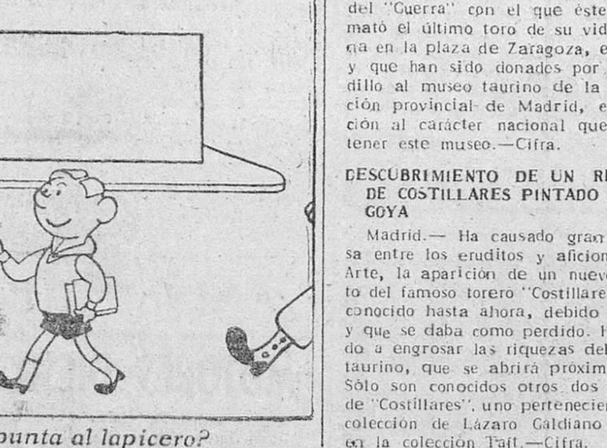
—¿Querría Vd. sacarme punta al lapicero?